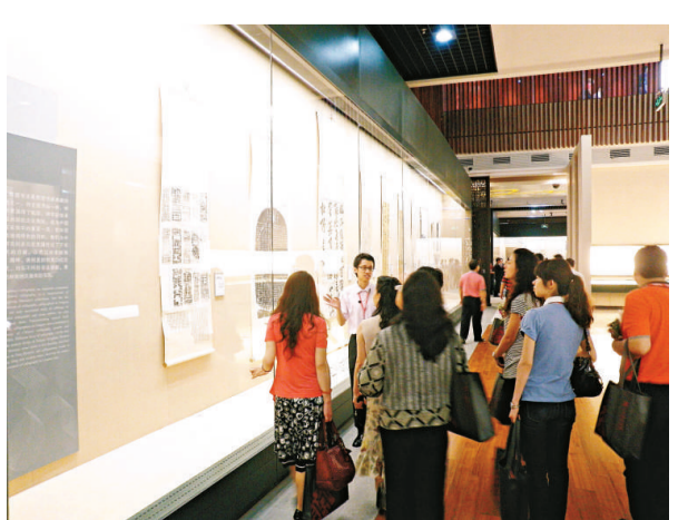
▲觀眾在觀看展品

其中一級文物四百零四件，自然標本、化石四萬餘件（套）；另外，還收藏圖書資料十餘萬冊。館藏的陶瓷和書畫藏品，無論數量還是質量，均居全國博物館前列，尤以「嶺南畫派」書畫藏品豐富而聞名；端硯和潮州木雕獨成系列、廣東出土文物、廣彩瓷器、石灣陶瓷、廣州牙雕、外銷畫等均具地方特色。