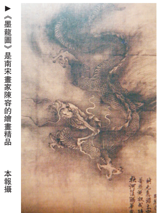
►《墨龍圖》是南宋畫家陳容的繪畫精品