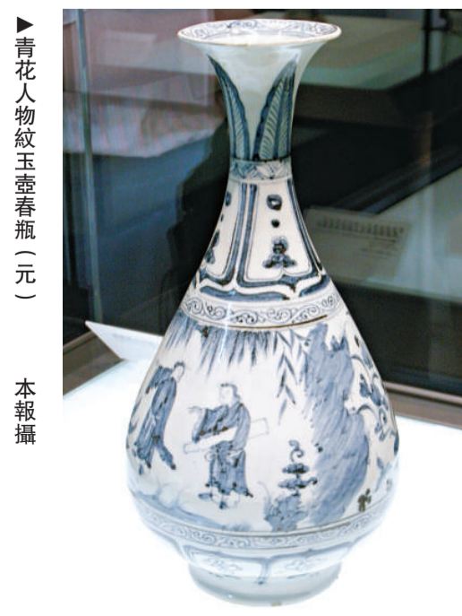
►青花人物紋玉壺春瓶（元） 本報攝