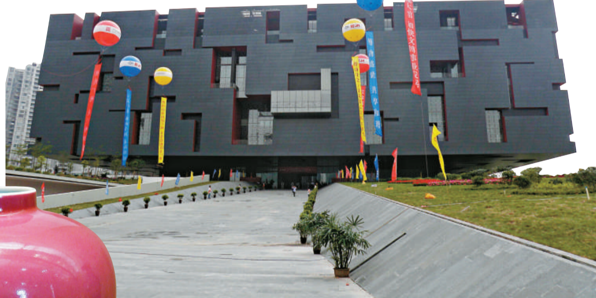
▲廣東省博物館新館外觀 本報攝 ▲清雍正景德鎮官窰胭脂紅釉罐 本報攝