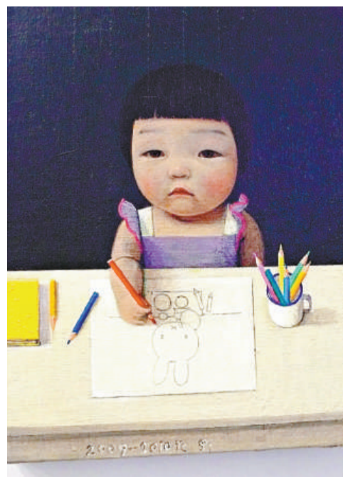
▲劉野筆下的這位《Small Painter》（小畫家）和劉野一樣愛畫Muffy兔 本報攝

劉野個展即日起至五月三十日於「香港國際藝術展10」中 Sperone Westwater 畫廊展出。