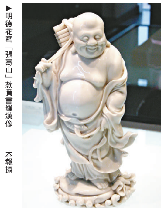
►明德花窰「張壽山」款負書羅漢像

歷史館用豐富的物證和文獻重點展示廣東三大民系，海上貿易歷史、廣東華僑史和近代史。自然館在近四千平