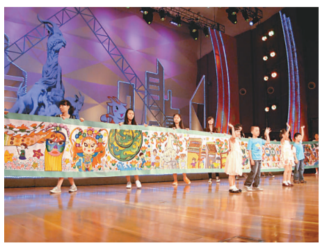
▲手繪畫《激情盛會 和諧亞洲》