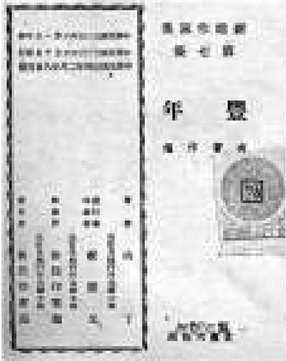
▲大多數舊書的標誌是由人手貼上的