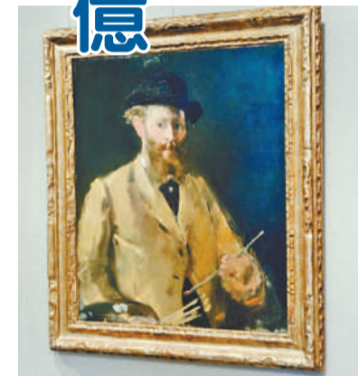
▲馬奈的《手持調色板的自畫像》

是次倫敦蘇富比印象派及現代藝術焦點拍品於五月二十九日至三十日在香港君悅酒店君悅廳展出。