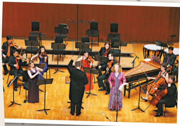
▲愛瑪·柯克比的演出展現優良的音質、自然的聲響

巴赫的第一九九康塔塔(Cantata，場刊誤為清唱劇Oratorio)《我的心在淌血》表述一名罪人由負罪自責直到得蒙上帝原宥其罪而深感欣慰的情緒演變過程。愛瑪·柯克比的表現形態十分謹慎，用聲純正、醇美、柔嫩，發聲不使勁，不用或少用顫音(Vibrato)，不過多的潤飾，完全按照自己的嗓音來演唱，非常尊重聲音，唱得輕鬆，聽得舒服。最可貴的是，愛瑪·柯克比的Pure tone唱法，並不平淡，而是有感情、有生氣、有修為，唱來既帶有早期音樂的明朗風格，又含有宗教