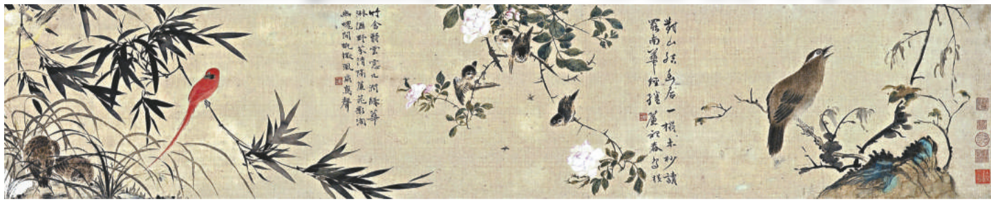
▲華岳《花鳥》手卷(局部)以一千九百多萬元成交

【本報訊】記者洪捷報導：佳士得春季拍賣昨日開鑼，這次拍賣其中一個重點是在「中國古代書畫」部分，當中最受矚目的石濤《杜甫詩意冊》山水冊頁，估價高達一億二千萬元港幣，結果是因沒有買家承價而流標。