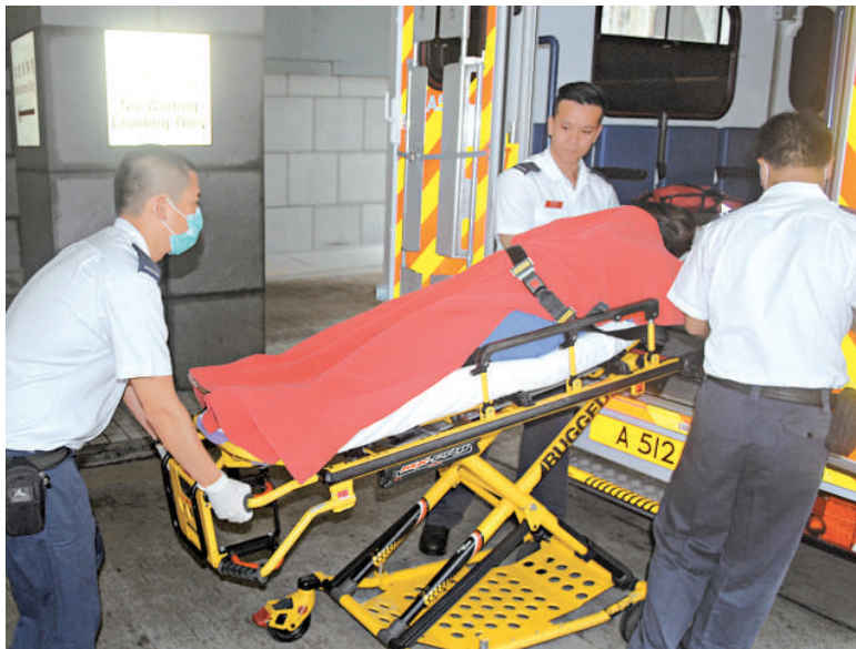
▲逃過一劫的孕婦被送院檢查