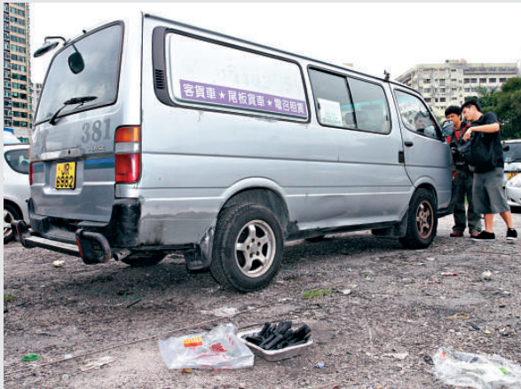
▲中年司機將客貨車變成毒氣室

及至下午一時十四分，有其他司機經過，發現事主倒臥客貨車內，並傳出陣陣燒炭氣味，忙拍打車身查看，他被驚醒，隨即自行報警，消防員到場將炭救熄。事主經救護員檢驗證實無礙，拒絕送院，又稱不會再尋短見，並多謝好心途人救回性命。