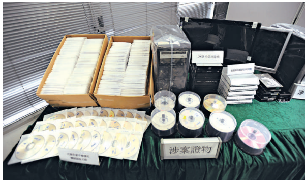
▶海關檢獲的盜版電影光碟

海關人員將男子押返其牛池灣住所，另檢獲約一千隻懷疑盜版電影光碟，一部用作燒錄盜版光碟的電腦，及一批外置硬盤，總值十七萬元。疑犯暫准以五千元保釋。