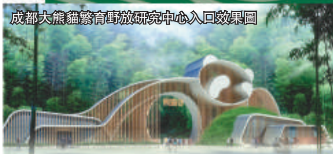
成都大熊猫繁育野放研究中心入口效果图