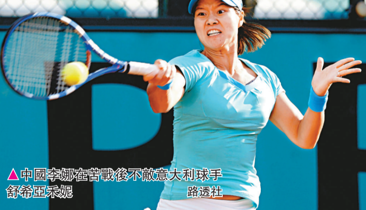
中國李娜在苦戰後不敵意大利球手舒希亞妮

男單方面，美國名將羅迪克以4:6、4:6、2:6負於世界排名114位的俄羅斯球手加巴舒華利，爆出第3圈的大冷門。