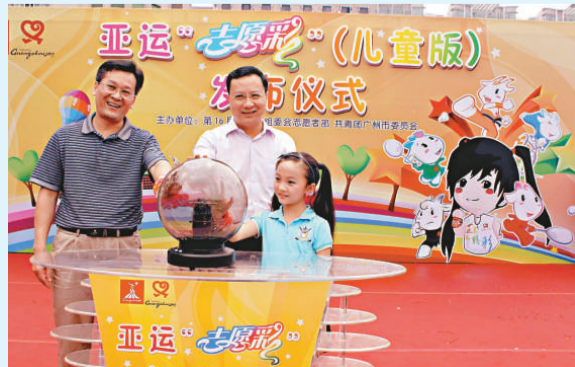
林妙可(右)和亞組委領導啓動兒童版「志願彩」

【本報記者袁秀賢廣州二十九日電】亞運「志願彩」(兒童版)發布儀式今天上午在廣州市少年宮舉行，奧運女孩林妙可作爲形象代言人出席，並和來自全市的500多名少年兒童一起參加了亞運動漫志願服務遊園活動，共同迎接即將到來的「六一」國際兒童節。