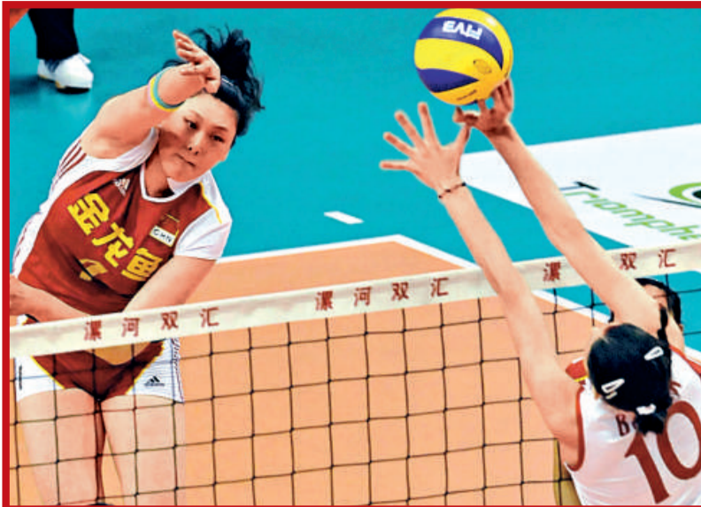
中國女排王一梅(左)在比賽中扣球