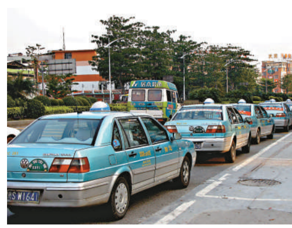
▲東莞今年以來發生多宗的士罷駛事件

造成本地的士無法生存。據他們估算，在常平跨市、跨鎮的出租車有近兩百輛，而本地的士才兩百多輛。而早期也有港商向記者反映，東莞常平下站後，經常能看見無牌營運的麵包車爭先搶客的混亂場面，有時因趕時間便上了車，但更多時候考慮到安全問題，還是會選擇正規的士搭乘。「搶客還是一回事，不少『黑的』還採取暴力搶食。」黃姓的士司機反映，他28日晚在常平一家星級酒店門口準備搭乘一名乘客，不料到卻遭到附近候客的私家車的阻攔，並將他的車胎扎破，而翌日凌晨另一名常平的士司機也發生同樣遭遇。的士罷工事件發生後，常平鎮政府立即介入協調處理此事，並請求東莞交通局通知周邊鎮的士不要進入常平轄區內營運。另外，當地鎮政府還將於明天召開會議，與罷運司機代表協商如規範管理等相關問題。