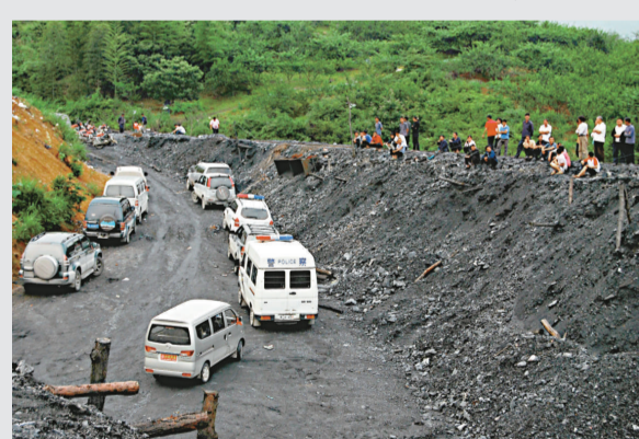
▲湖南郴州曙光煤礦爆炸事故現場

中國湖南省煤炭安監局證實，湖南省郴州市一煤礦發生爆炸事故，目前已造成17人死亡。據悉，29日下午4點左右，存放在事發煤礦煤洞內的炸藥發生爆炸，產生大量有毒有害氣體，致使井下當班作業的17名礦工遇難，1人受傷。發生爆炸事故的曙光煤礦位於郴州市汝城縣文鄉鎮境內，該煤礦始建於1971年。（中新社）