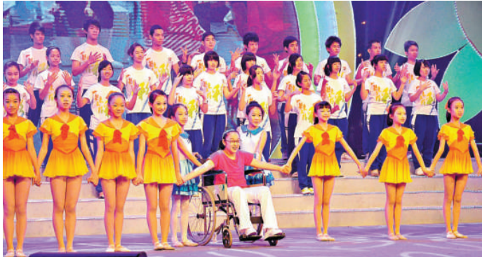
普通兒童與特殊兒童同台表演廣州志願者歌曲《一起走》