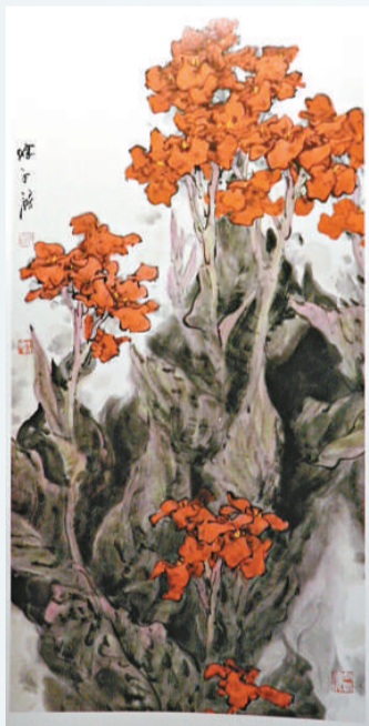
▲廣東陳永鏞《美人蕉》