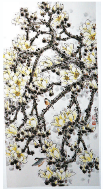
▲澳門劉光業《玉潔冰清》