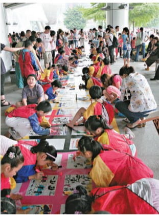
「魅力羊城，多彩亞運」繪畫活動現場熱鬧

「魅力羊城，多彩亞運」青少年兒童迎亞運、美化亞運城藝術創作」少兒現場繪畫活動也在戶外廣場進行得如火如荼，近百名廣州少年宮美術學校及特殊教育中心的學員揮動畫筆，描繪心中美麗花城，並用畫筆抒發對亞運會和亞殘運會的祝福與期待。