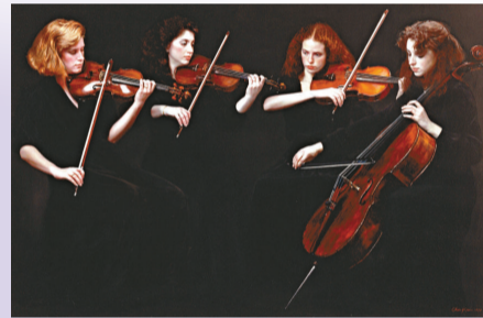
▲陳逸飛畫作《弦樂四重奏》

【本報訊】香港佳士得「亞洲當代藝術及中國二十世紀藝術」五月二十九日舉行的夜間拍賣會，總成交額逾3.03億元，成交率高達100%，創下了「白手套」拍賣佳績。