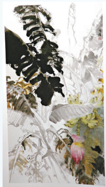
▲香港司徒乃鐘《翠影丹心》