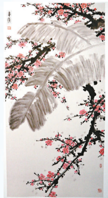
▲廣東陳章績《嶺南早春》