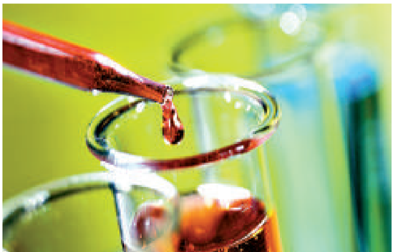
▲英國研發出一種簡單血液測試，可以在腫瘤成形前診斷出癌症

創出這種彩虹玫瑰的是荷蘭花商彼得·范德威爾肯。他購買長莖的米白玫瑰Vendela，將其染色，然後分銷到世界各地。彩虹玫瑰除了色彩艷麗，還能散發出香甜味，存放時間和普通玫瑰一樣，但葉子會較快枯萎。(綜合報道)