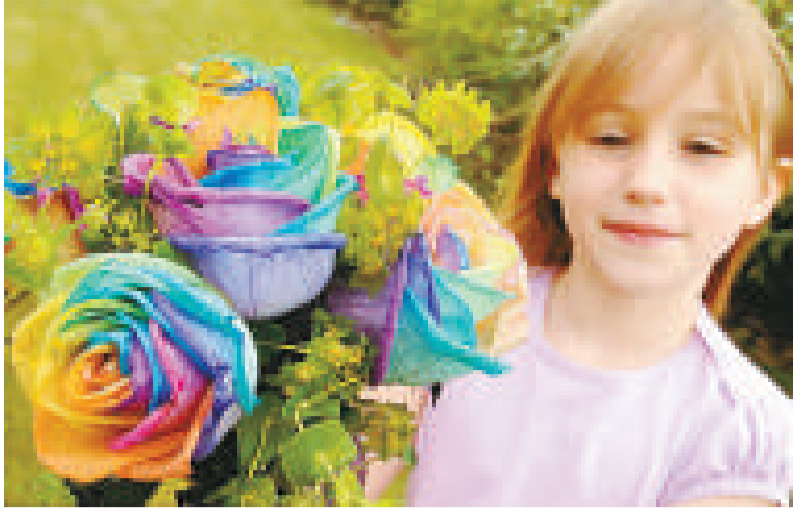
▲一打彩虹玫瑰售價約736.46港元

《時代》雜誌的著名藝術批評家羅伯特·休斯在《美國視野》(American Visions)一書中把布儒瓦尊為「美國女性主義身份藝術之母」，並說她的影響力巨大。休斯指出，她最大的獨特之處在於她所採用的性意象，她「由內而外」地探索女性的特質，而不是像傳統的男性藝術家那樣以女性的外表為着眼點。(綜合報道)