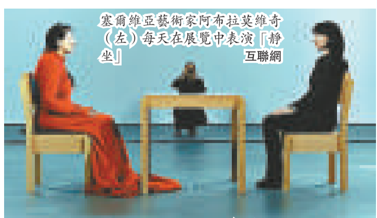
塞爾維亞藝術家阿布拉莫維奇(左)每天在展覽中表演「靜坐」