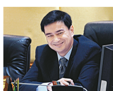
▲避過不信任動議的阿披實面露微笑

聯合國人權事務高級專員公署（The UN High Commission for Human Rights）呼籲獨立調查泰國政治危機，為那些違反人權的事