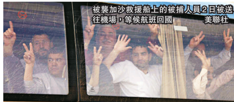
被襲加沙救援船上的被捕人員2日被送往機場，等候航班回國