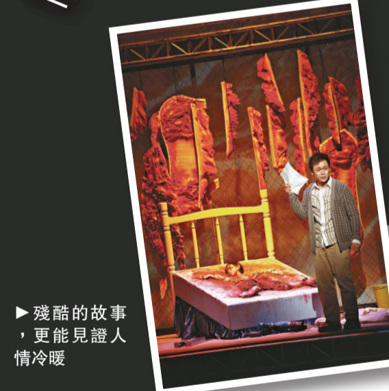
▶殘酷的故事，更能見證人情冷暖

風車草劇團新作《小心！枕頭人》是一齣充滿暴力、彰顯社會陰暗面的翻譯劇（原劇是由馬丁麥多納創作的《Pillowman》），可能基於個人口味的緣故，《小》劇導演米高杜本（來自加拿大）為香港話劇團執導的《奇幻聖誕夜》亦是此類作品。