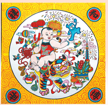
▲年畫作品《祥和世博》

此外，他們還攜帶最具有武強年畫代表意義的年畫一同到世博會上進行現場印刷和散發，在輕鬆愉快的氛圍中尋求合作與商機，擴大年畫產業規模。