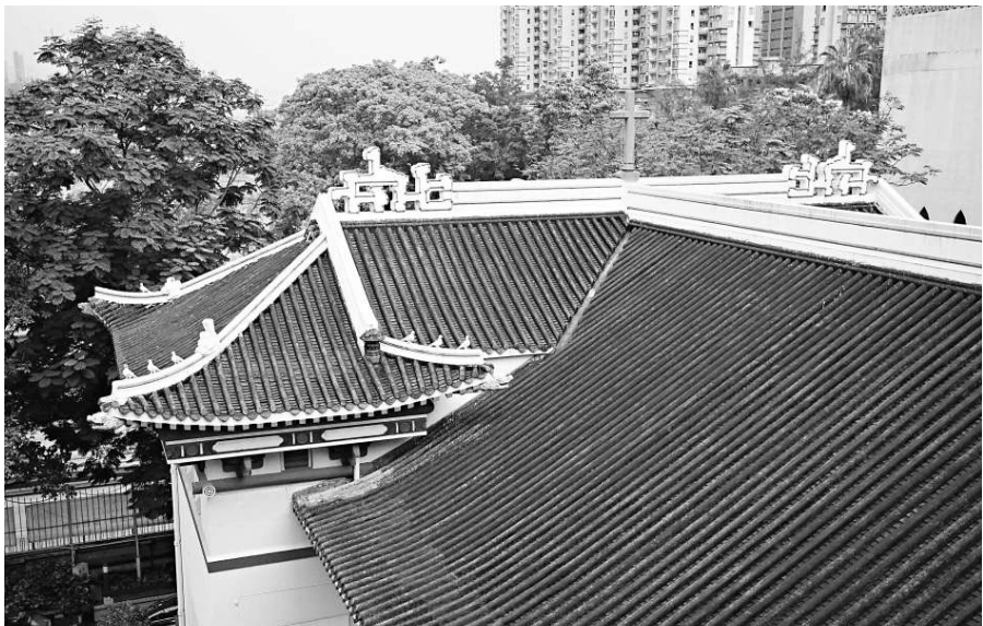
▲聖三一堂的中國傳統屋頂