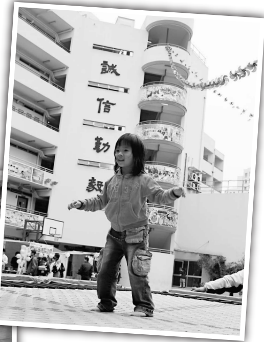
▲小朋友試彈跳繩 ▲學生教導小朋友製作小飾物