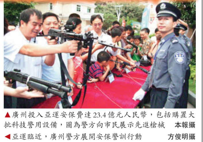
▲亞運臨近，廣州警方展開安保警訓行動