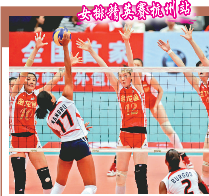
▲中國女排三人躍起攔網

據悉，「黃金籃球灌軍賽」將在廣東、湖南、廣西、河北、海南五大賽區內15個城市密鑼緊鼓地展開，9月底，12位來自5大區的高手將在廣州會師，決出「神州第一灌」。