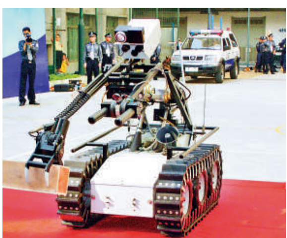
▲大型排爆機器人等高科技設備「增援」，廣州亞運城將變成固若金湯的「安全之城」

廣州警方透露，最近正在購置大批科技警用設備，包括大型排爆機器人、拋投式偵查機器人、便攜式炸藥探測器等，其中僅一台大型排爆機器人價值人民幣約350萬元。警方強調，廣州亞運安保信息化在近期建設完工後，會像北京奧運會一樣，預留出一個「演練期」；而隨着該批安保專用高科技設備的「增援」，比賽期間亞運城將變成固若金湯的「安全之城」。