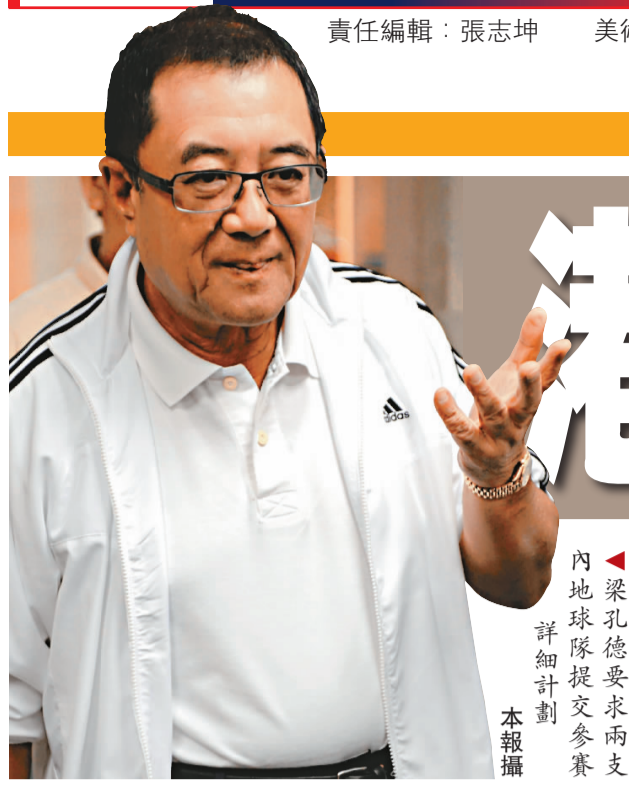
內地足球隊提交參賽詳細計劃