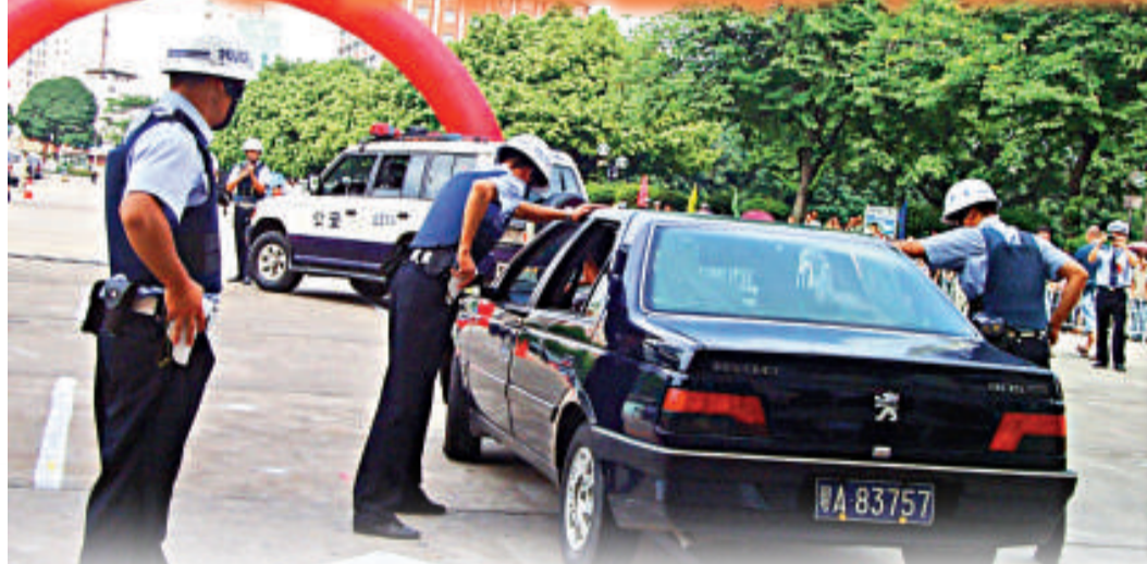
▲廣州投入亞運安保費達23.4億元人民幣，包括購置大批科技警用設備，圖為警方向市民展示先進槍械