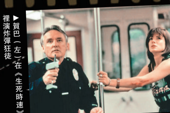
▶賀巴(左)在《生死時速》裡演炸彈狂徒