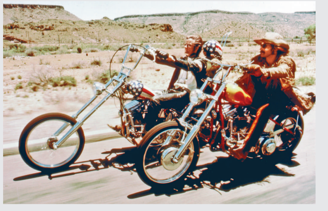
▶彼得方達(左)與賀巴合演的《迷幻車手》，對美國電影業造成深遠影響