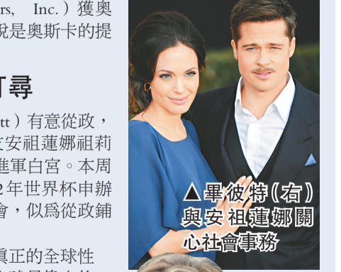
▶畢彼特(右)與安祖蓮娜關心社會事務