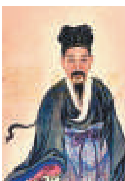
▲北宋名書法家黃庭堅畫像