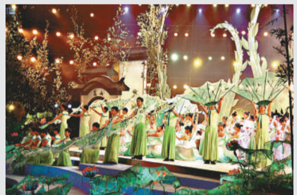
▲首屆中國農民藝術節開幕式文藝晚會演出舞台