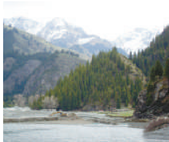
▲在天池南岸工作人員還在進行清淤沙工程