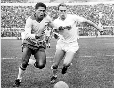
►加林查（左）球場上威風八面，私生活卻一場糊塗

一條腿比另一條短6厘米；和數十個女人上過床、留下14個孩子；3次參加世界杯、2次奪冠；開車出了車禍令岳母喪命、自己則死於酗酒。這個被認爲是足球歷史上盤球最出色的人，就是