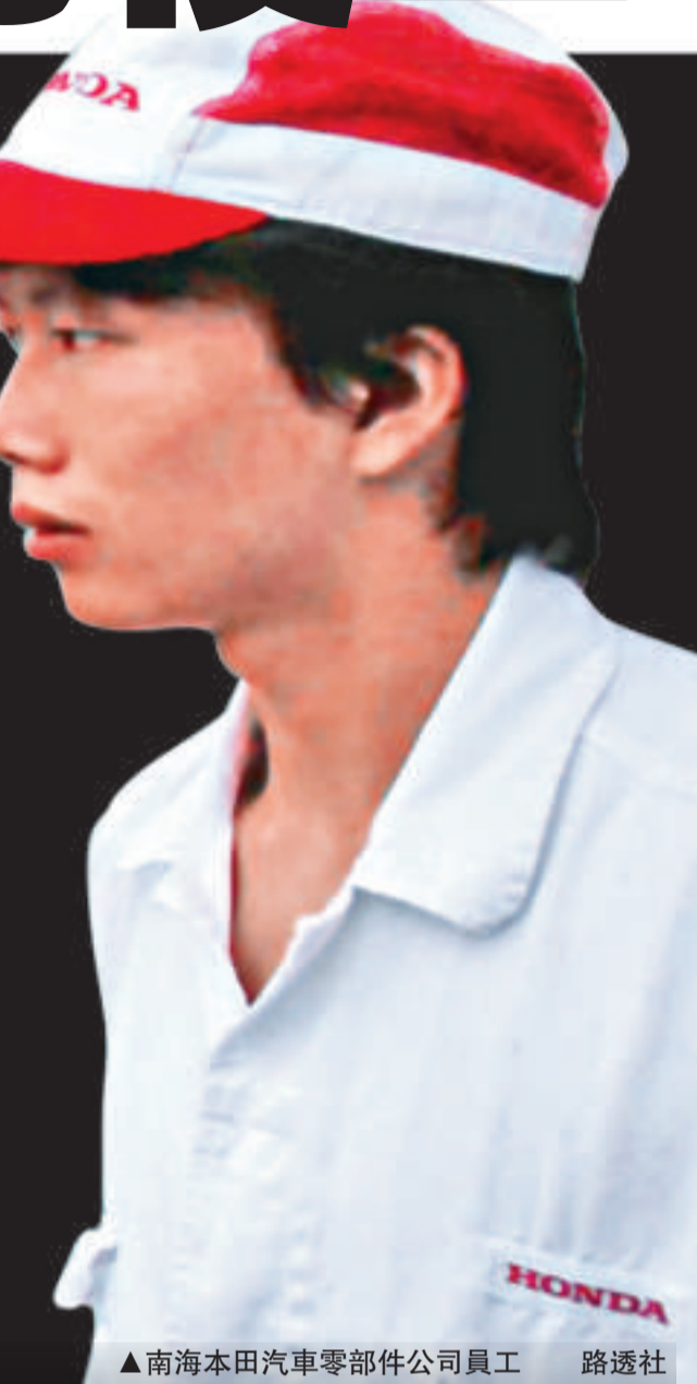
▲南海本田汽車零部件公司員工

據悉，在今天談判中，由於時間拖延超過5點30分原定的結束時間，有南海本田組裝車間工人認為談判破裂而再次停工。談判代表隨即暫時中止談判，將工人勸返工作後，談判才繼續展開。