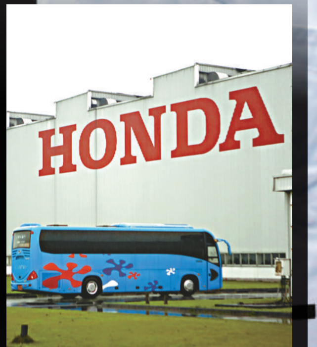
▲南海本田汽車零部件公司接送員工的巴士