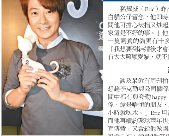
▲孫耀威自認友誼先生