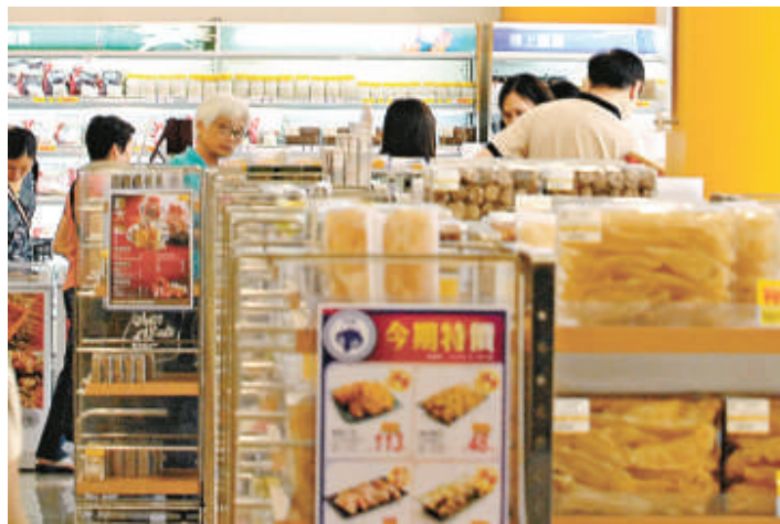
▲發現鼠蹤的燕窩店 ▶遭惡鼠咬傷清潔工（左）送院治理

昨日上午十一時十九分，該燕窩店開門營業期間，職員發現天花板有一隻老鼠，因身體不動，以為中了老鼠藥餌「已死」，通知商場派員清理。兩名男女清潔工人稍後到場，由於眼見老鼠不動，男工遂伸手欲檢走，詎料「假死」老鼠突然發惡張口狂噬，男工冷不提防未及縮手，慘被咬中右手虎口位，手套亦遭咬破，當場受傷流血。他忍痛取棍將老鼠打死，然後報警求助，由救護車到場送往屯