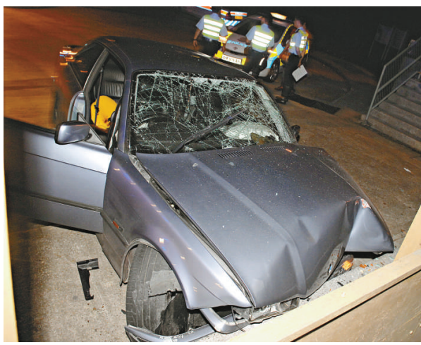
▲失事房車車頭損毀，擋風玻璃破裂

昨日凌晨三時二十分，一輛寶馬私家車載着三男一女，沿城門道上山行駛，在上址轉左彎時失控剷上行人路，直撞路旁候車亭石壘，車頭嚴重凹陷，擋風玻璃碎裂，三名男女乘客受傷一度被困，需消防員到場救出，送往瑪嘉