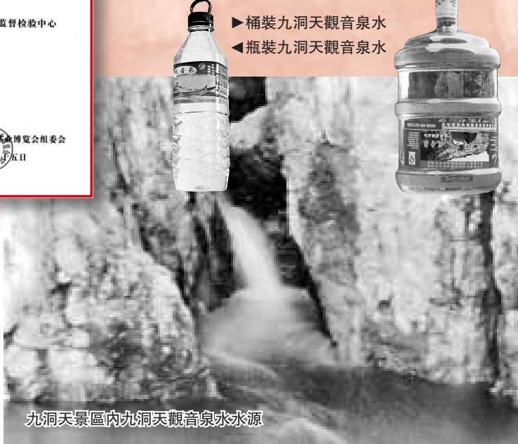
九洞天景區內九洞天觀音泉水水源