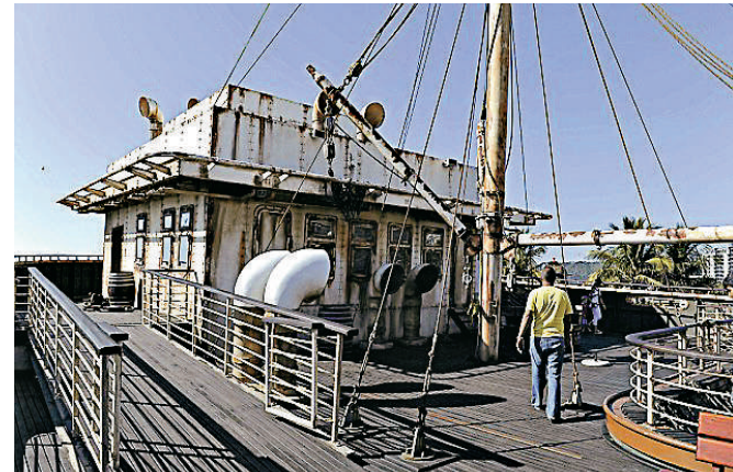
▲這家名為「貨艙」的餐廳，是在南非富有傳奇色彩的鬼船「幽靈」仿製船中建成的