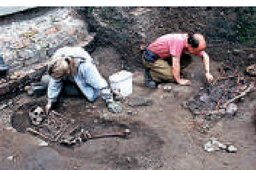
▲考古學家在英國約克郡發現了大批羅馬時期鬥獸場角鬥士的骸骨