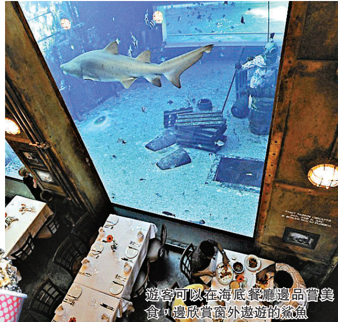
遊客可以在海底餐廳邊品嚐美食，邊欣賞窗外遨遊的鯊魚