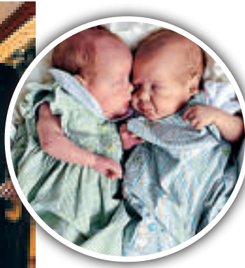
▲卡倫最近生下的一對雙胞胎