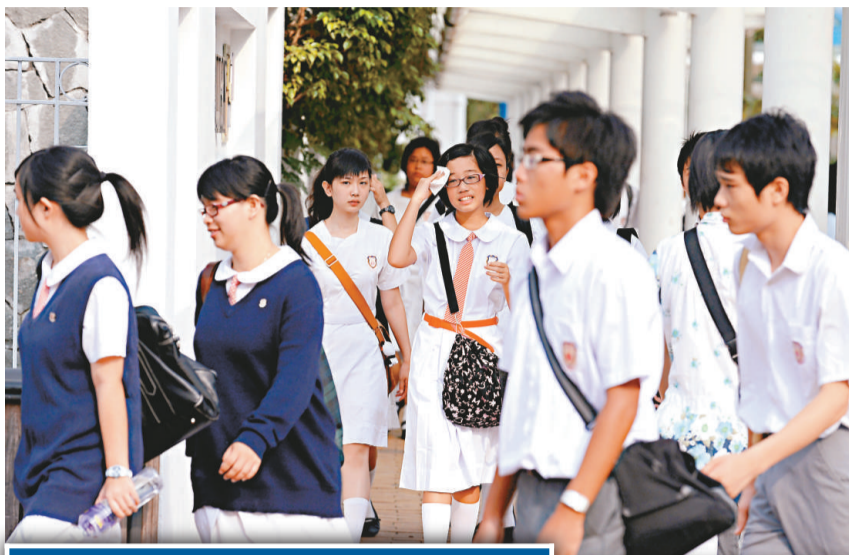
◀ 中學會考將於八月四日放榜 資料圖片

另外，教育局去年二月向學校派發會考考生出路小冊子，明天（九日）將再舉辦中五畢業生和家長座談會介紹出路。今年當局特設會考考生網頁（www.edb.gov.hk/lastcohort）介紹各種出路。考評局在放榜前後，將以短訊方式向自修生發放升學資訊。