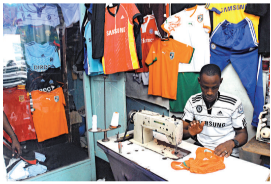
▲一位裁縫在科特迪瓦的阿比賈趕製盜版球衣，這些球衣會以5美元零售價在南非出售

貨物，包括總值約250萬美元的各國國家隊球衣，有關方面透露偽造貨品主要來自中國、亞洲其他地方甚至非洲鄰國科特迪瓦等地，促請司法機關和獲認可的生產商檢討保安制度。