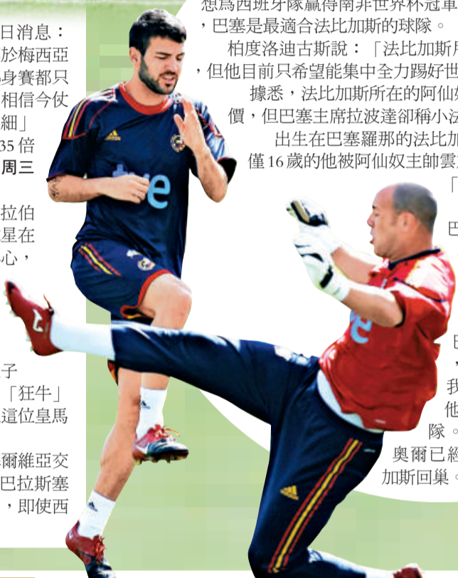
▲連拿(右)與法比加斯在訓練時短兵相接

【本報訊】新華社馬德里六日消息：法比加斯在西班牙隊的隊友柏度洛迪古斯6日表示，儘管最近有法比加斯轉會巴塞隆納隊的消息甚囂塵上，但法比加斯目前還是心無旁騖，一心只想為西班牙隊贏得南非世界杯冠軍。另一位巴塞主將沙維只是說，巴塞是最適合法比加斯的球隊。 柏度洛迪古斯說：「法比加斯用他出色的發揮贏得了巴塞的青睐，但他目前只希望能集中全力踢好世界杯。」 據悉，法比加斯所在的阿仙奴球會已經拒絕了巴塞3500萬歐元報價，但巴塞主席拉波達卻稱小法仍有很大希望加盟巴塞。 出生在巴塞羅那的法比加斯出自巴塞青訓營，2003年，當時年僅16歲的他被阿仙奴主帥雲加相中，從此，西班牙中場開始了他在「槍手」的職業生涯。 對於法比加斯可能的回歸，效力於巴塞的柏度洛迪古斯說：「我當然希望在巴塞見到他，他已經離開很長時間了。他對巴塞的一切都十分熟悉，我相信如果加盟巴塞，他一定會為球隊做出很大貢獻。」同樣效力於巴塞的沙維也歡迎小法重回巴塞，他說：「如果他能來巴塞，我會十分高興。我已經告訴他，巴塞是最適合他的球隊。」 早前巴塞隊長佩奧爾已經開口力邀法比加斯回壘。