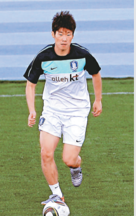
▲韓國國家隊隊長朴智星

所不能。分組賽對牙買加他取得鎖定勝局的第3球，對日本他的一記巧射，幫助球隊全取3分。 進入16強後，蘇加盡顯英雄本色。當球隊在對羅馬尼亞獲得12碼時，蘇加騙過了對方門將，將球射進右下角。然而球證卻以有人提前進入禁區為由要求重射。蘇加絲毫沒有受到影響，在習慣性地用手摸了摸頸部脈搏穩定情緒後，再次把球準確地射進左下角，克羅地亞亦憑藉這個12碼晉級8強。 克羅地亞在4強的對手是法國。蘇加利用出色的個人技術，突入禁區攻進該屆的第5球。如果不是法國後衛杜林的梅開二度，克羅地亞將創造首次組隊參加世界杯便打進決賽的紀錄。在季軍戰中，蘇加不負眾望，攻入致勝一球，幫助球隊以2:1戰勝荷蘭，並以6個進球獲得了「金靴獎」。 蘇加直到退役為止，一共為克羅地亞射入45球，成為這個年輕的國家歷史上進球最多的射手。 王林