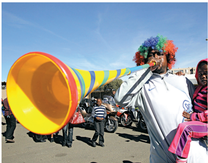
▲南非傳統號角是當地球迷的「打氣之寶」

南非世界杯籌委會主席丹尼佐敦表示：「vuvuzela將會在今屆世界杯上出現，它是今次世界杯的一部分。」丹尼佐敦表示會呼籲球迷避免在奏國歌時吹號角，但卻不會明文禁止。國際足聯主席白禮達也支持vuvuzela可以響徹球場，表示它在南非足球的地位就等同傳統的鈴鼓，又或是在其他國家的球迷高唱隊曲一樣。 在去年的洲際國家杯，不少前來參賽的教練和球員都投訴球場內過度喧鬧。有研究更加顯示，身處這樣嘈雜的環境，可能令聽覺永久受損。研究顯示號角聲音高達127分貝，打鼓聲音亦達122分貝，而球證的笛聲就有121.8分貝，專家警告只消暴露在達至100分貝或以上的環境下15分鐘，足以令聽覺永久受損。