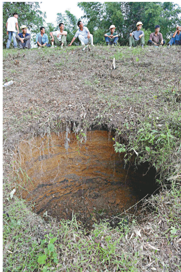
▲八日，人們在大壩出現大坑的上方待命