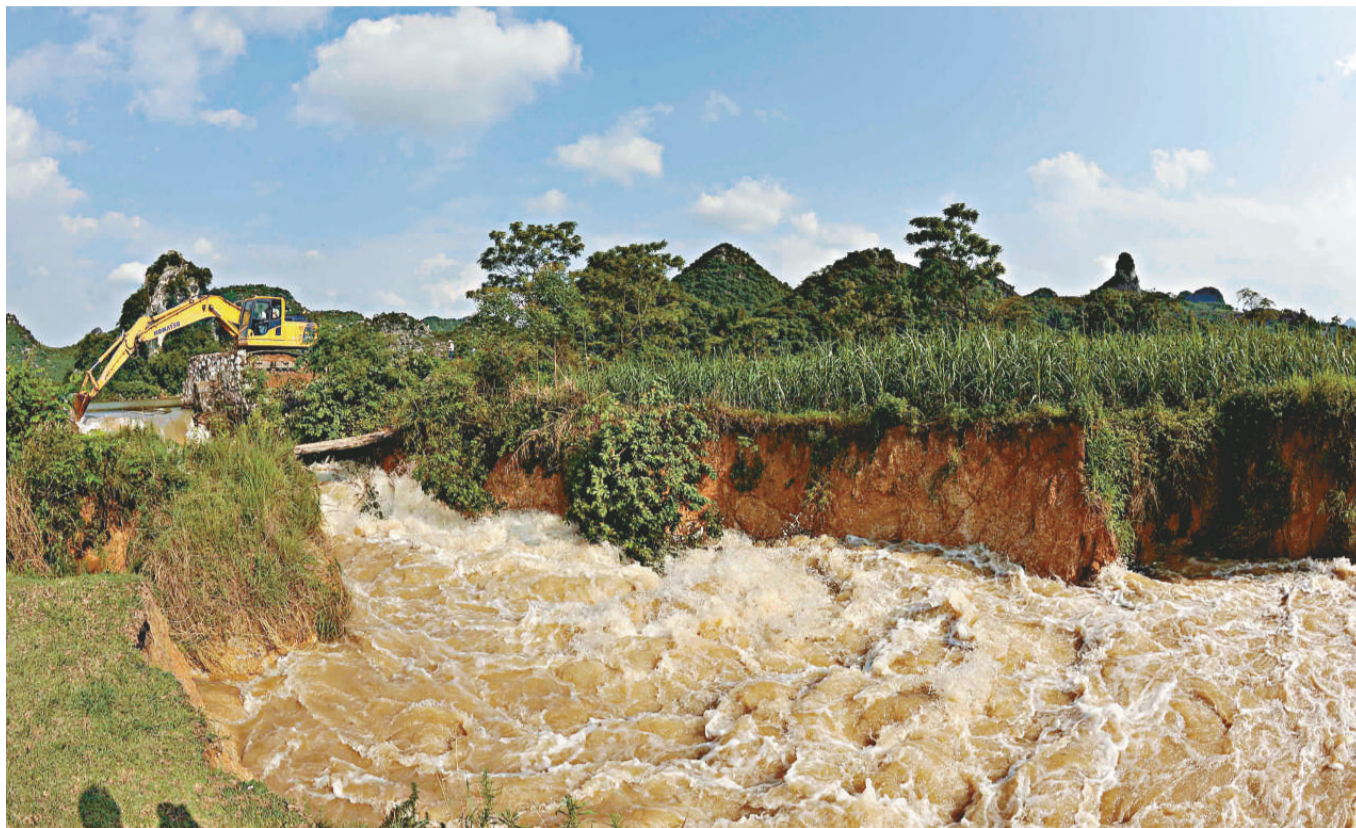
▲八日，在廣西凌口水庫，一台挖掘機正在擴大泄洪口

6月3日，距凌口水庫約5公里的廣西來賓市與賓區良江鎮吉利村出現地陷地質災害，在村邊的一座山下形成了4個巨坑。地陷造成當地房屋牆體出現開裂、傾斜、倒塌現象，並波及到附近的山背屯和一座小型水庫。