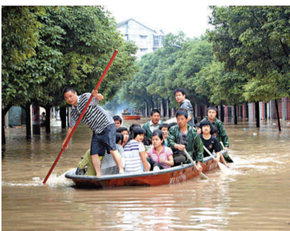
▲湖南溆浦縣緊急轉移被洪水圍困的楚才中學考點高考學生

據氣象台最新預報，8日夜間到9日白天，貴州降雨將會減弱，但南部邊緣地區局部仍有中到大雨。