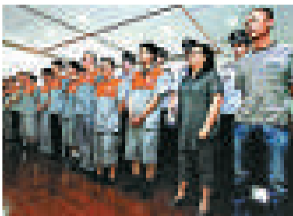
▲十四名被告到庭受審