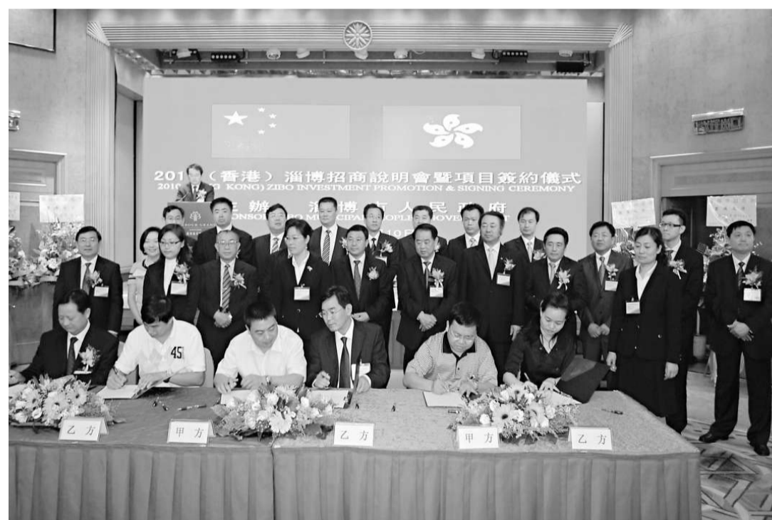
▲ 淄博招商說明會暨項目簽約儀式

集團、中國光大國際有限公司、香港貿發局、香港山東商會、香港中華總商會、冀魯旅港同鄉會、中國航天萬源國際集團、香港新馬泰歸僑華人聯合會、中國長城集團、中海外集團、中國（香港）國際經貿合作協會、中國城市競爭力研究會、中國國際貿易促進會、香港台灣工商協會等數十個政府及金融機構、社團組織、企業財團的負責人應邀出席儀式。