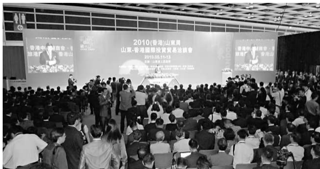
▲ 2010（香港）山東周活動啟動儀式暨山東—香港國際投資貿易洽談會開幕式

在山東—香港國際投資貿易洽談會上簽約的4個合同項目分別是：宏達礦業香港上市項目，由淄博宏達礦業有限公司與新加坡中鋼投資有限公司以股權並購的形式合作，外方投資2億美元，總投資5億美元；山東勝利鋼管有限公司與新加坡中華石油裝備有限公司以增資方式合作的高等級油氣輸運管道生產項目，外方投資1.8億美元，總投資2.5億美元；山東躍微玻璃纖維有限公司與香港銳發有限公司合資生產高檔電子基布，外方投資1.5億美元，總投資2.9億美元；山東匯贏新材料科技有限公司與中國環保新材控股有限公司以增資方式合作的精細化工項目，外方投資1.68億美元，總投資2.5億美元。這些項目落戶淄博市後，將有力推動淄博市轉方式調結構、加快經濟社會科學發展、推進股實和諧經濟文化強市建設步伐。