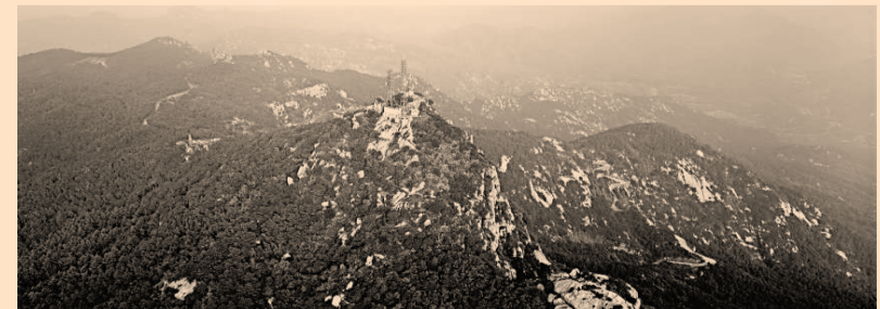
▲ 魯山國家森林公園