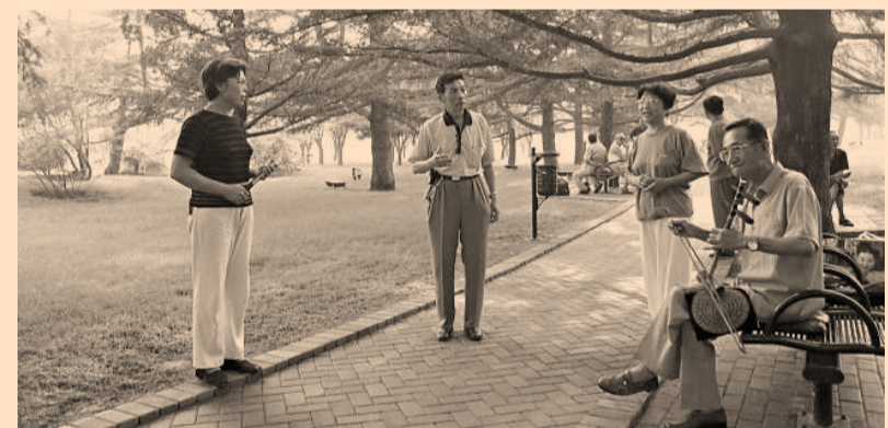
▲ 淄博是一座和諧宜居的城市

「法治淄博」建設重點是，着力提高公民法律素質，在全社會形成自覺學法用法守法的濃厚氛圍；着力提高依法執政水平，努力建設人民滿意的服務型政府；着力提高司法公信力，維護司法權威和社會公平正義；着力提高基層民主法治建設水平，築牢「法治淄博」建設的基礎；着力提高地方立法水平，逐步形成與國家法律體系相配套、與「法治淄博」建設相適應、富有淄博特色的較為健全的地方法規和規章體系。