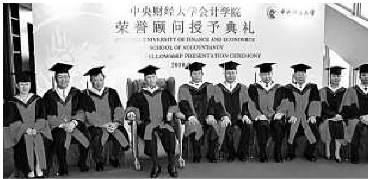
▲中央財經大學副校長陳明（左五）、會計學院院長孟焯（右五）與榮譽顧問何鴻燊（左四）、郭炳湘（左三）、李國寶（右四）、方潤華（右三）及馬時亨（左二）在頒授儀式上合影

養終生學習的態度，因為學問不僅個人終身受用，更可惠澤社群。郭炳湘表示，隨着現今社會趨向知識型經濟專業發展，中央財經大學在硬體及軟體的建設都優秀卓越，為國家的發展，貢獻良多。今後，他定當積極努力，與中央財經大學攜手，為國家的經濟發展竭盡綿力。李國寶表示，中央財經大學薈萃中國和海外優秀的人才及完善的配套設施，促進知識和經驗的交流，成就非凡，他非常敬佩中央財經大學追求卓越的精神，熱切期望日後能為大學發展貢獻綿力。方潤華表示，教育是強國富民之道，他支持祖國的教育工作，積極為國家培育優秀人才。馬時亨希望各界支持推動教育事業，令更多學子受惠，將來學有所成，貢獻國家。