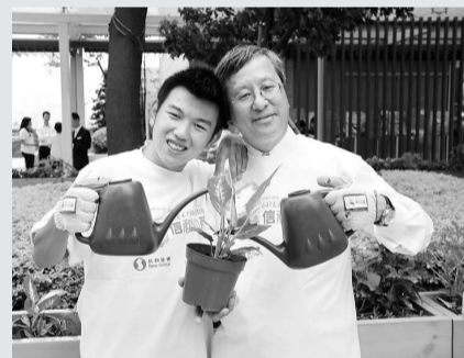
◀匡智會與信和集團合作幼苗助養計劃為智障學員找到就業出路

【本報訊】實習記者張淑晴報導：智障人士也可以自食其力。匡智會綜合職業訓練中心園藝培訓，讓六位學員有能力協助綠化商廈，找到職業出路。