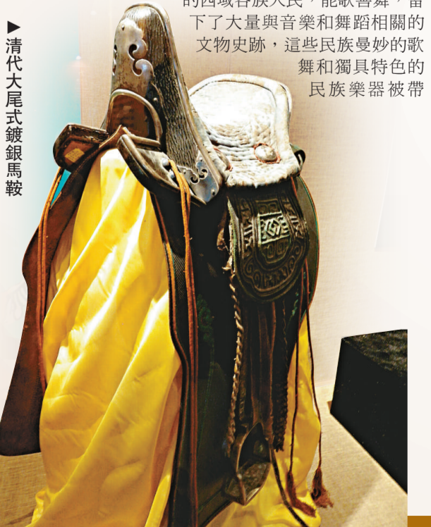
清代大尾式鑲銀馬鞍