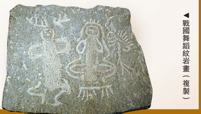
戰國舞蹈紋岩畫（複製）