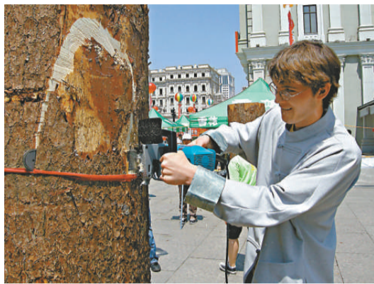
來自美國的青年雕塑家James Stugart用電鋸創作

【本報訊】實習記者張輝哈爾濱報導：「2010中國·黑龍江元豐國際木雕藝術節暨中國黑龍江造型藝術產業園啓動儀式」日前在哈爾濱舉行。來自俄羅斯、美國、日本、韓國、芬蘭、匈牙利等國外雕塑家和我國著名雕塑家共十五人在哈爾濱建築藝術廣場進行現場創作展示，讓群眾零距离欣賞木雕作品從原木到成品的生產過程。本屆木雕節由黑龍江省文學藝術界聯合會等單位主辦，賓西股份有限公司等單位協辦，中俄元豐木材加工批發大市場等單位承辦。