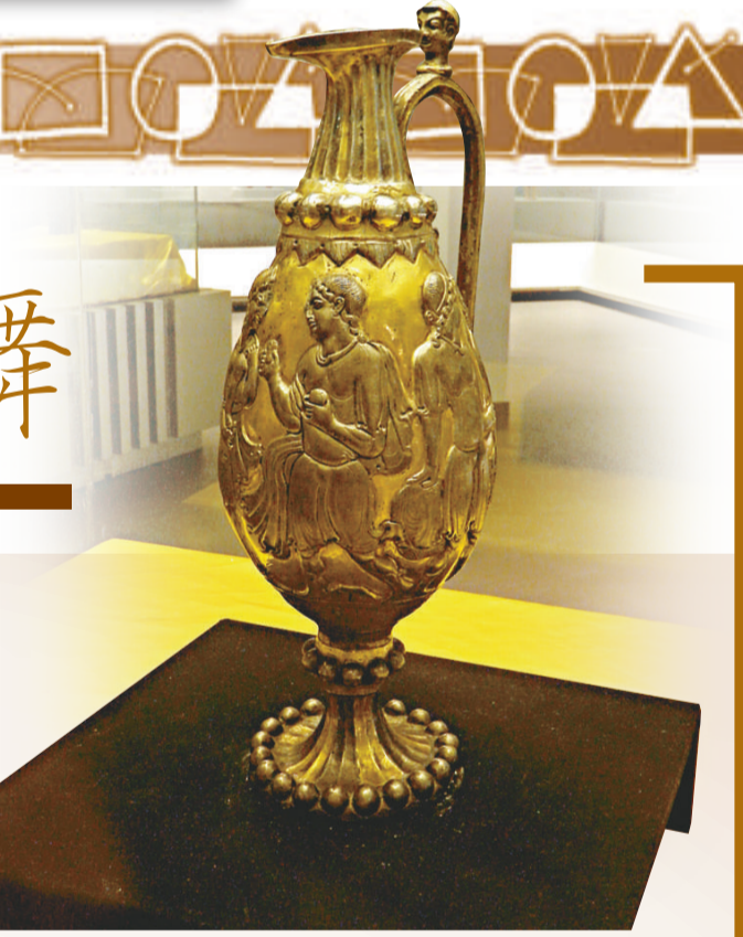
出土於固原南郊大型貴族墓的鑲金銀壺

公元三世紀至七世紀的中亞強國——波斯薩珊王國所生產的一件金屬手工藝品，距今已有一千五百年的歷史，其精湛的手工藝技術具有典型的薩珊波斯金銀器風格。不過，在這件薩珊波斯的金銀器上，卻用典型的波斯「凸紋裝飾工藝」描繪着大家熟悉的古希臘神話故事。