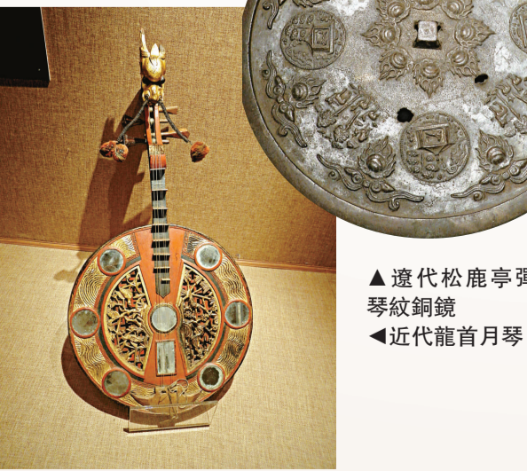
遼代松鹿亭琴琴紋銅鏡