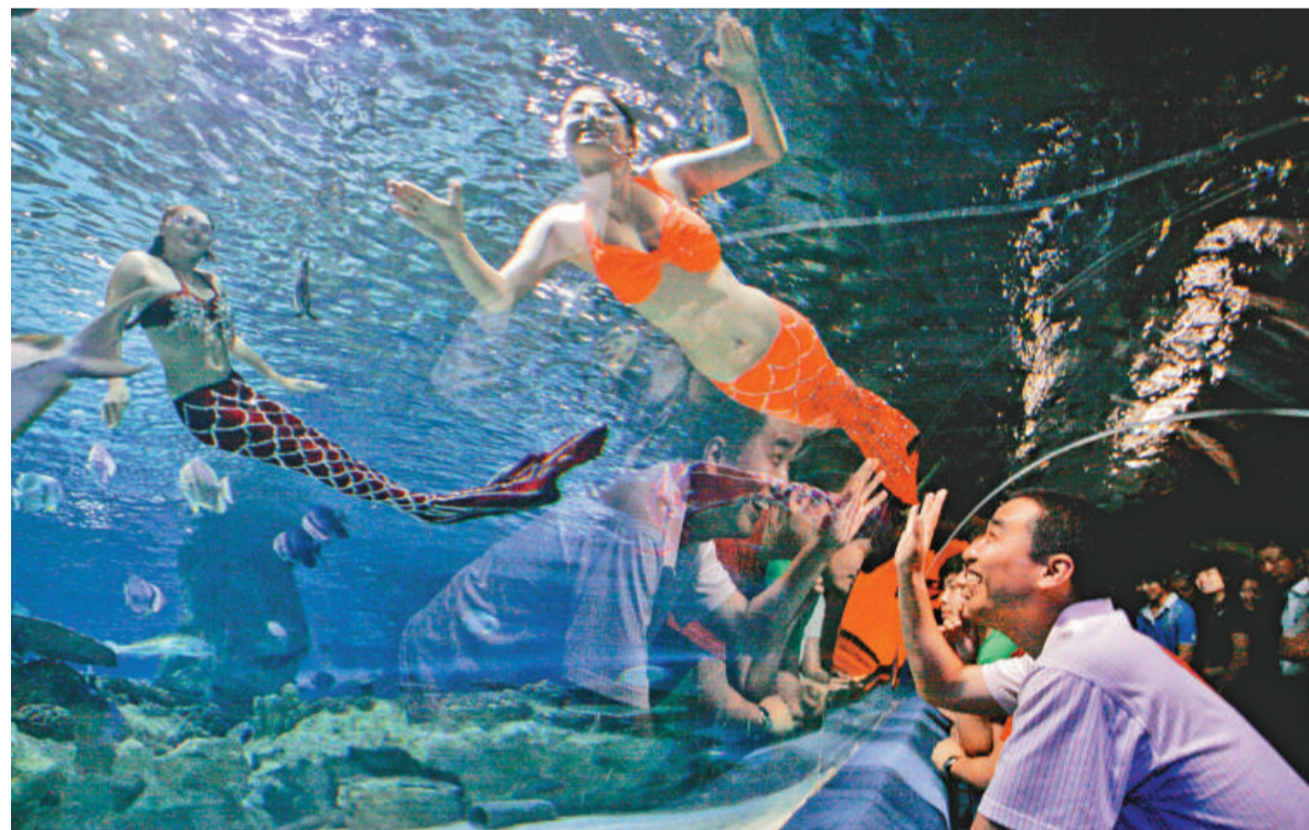
俄「美人魚」游到北京 10 日，在北京富國海底世界，三位來自俄羅斯的美女正在進行精彩的「水下美人魚」表演。此次來華的四位演員都曾在俄羅斯的專業表演隊伍中服役，擁有世界頂級花樣游泳實力，並從小接受嚴格的芭蕾舞訓練。