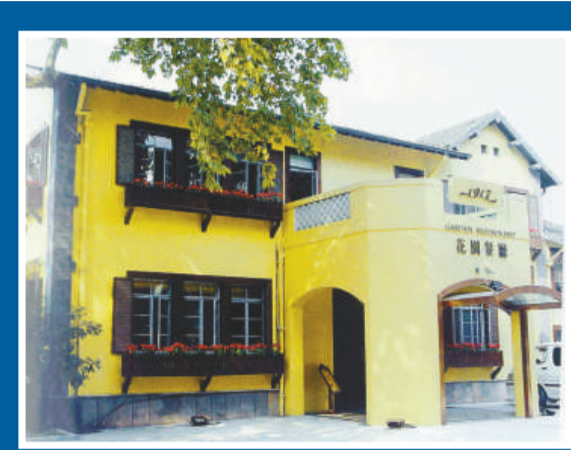
▲南山路上由別墅改造成「1917花園餐廳」