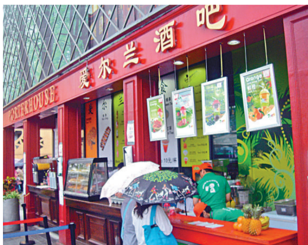
▲愛爾蘭館的酒吧除了供應啤酒外，還特別為女性球迷推出一系列果汁飲料

一間「德國啤酒屋」，憑藉聞名全球的「德國黑啤」，酒吧內人氣爆棚。工作人員透露，啤酒屋的所有製酒原料均源自德國，「除了黑啤，我們還有黃啤，味道都不錯，世界期間，啤酒屋工作人員都會穿上統一的特色運動裝，與世博觀眾一起看世界杯」。