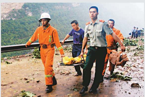
▲重慶武隆縣境內的國道12日發生山石掉落，造成兩輛途經車輛上3人死亡2人受傷

科學與人為專家張田勛接受本報記者採訪時表示，通過最新的北京醫改方案可以看出，政府正將財政收入逐步偏向於醫療改革方面，以解決「看病難」、「看病貴」等重要民生問題。醫改方案正在一步步完善醫保報銷制度，提高報銷份額，讓更大範圍公民能夠享受醫保待遇，使更多患病的病種得到報銷。