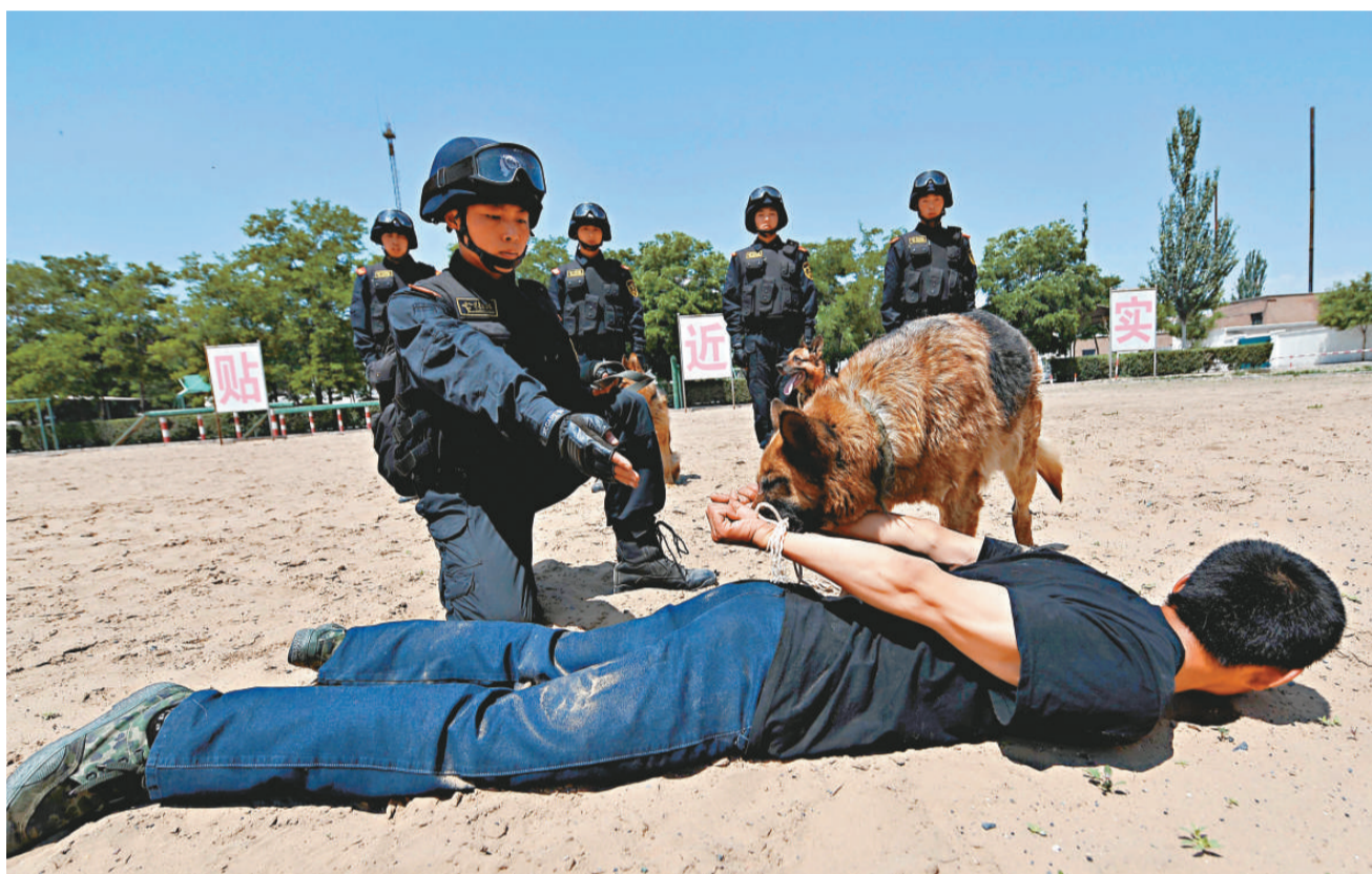
▲武警寧夏總隊直屬支隊特勤中隊警犬班12日開展夏日警犬大練兵

【本報訊】連日來，已有三艘貨船在渤海灣黃驊海域遭遇海盜搶劫。劫匪要挾船員交出5萬至10萬元，不僅打傷船員，搶走現金和財物，還揚言誰報案就殺死誰，氣焰十分囂張。據目擊者稱，操當地口音的海盜駕駛掛有牌照「冀黃漁」字樣的漁船進行劫掠，海警已展開全面偵查。