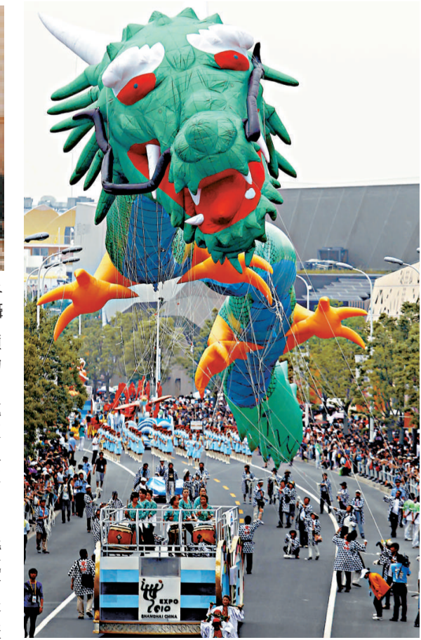
▲日本民間藝人操控一隻巨大的「日本龍」12日在世博園區巡遊

品完「遣唐使」歷史，遊客可穿越「時空隧道」，走過代表現代生活的春夏秋冬，隨後進入充滿高科技魅力的未來。在未來的家居生活裡，地板由發電瓷磚組成，能把壓力轉化成能量，居民只要踏上幾腳，蹦跳幾下，地板就會發電。窗戶不僅能透光，還成了發電機。客廳牆壁是融合了電視、電話、音響等於一體的多媒體「生活牆」，用手點擊牆上的電視機圖標，就可以打開高清電視；點擊電話圖標，就能和親友打上視頻電話。