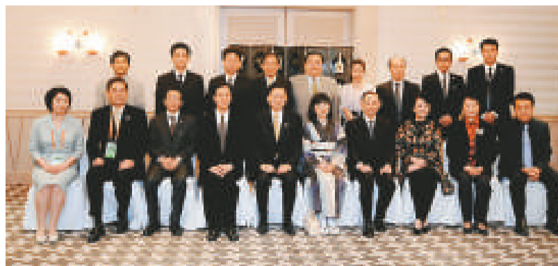
▲日本首相特使鳩山由紀夫12日參加世博會日本國家館日活動，並會見梅葆玖、阪東玉三郎、梁谷音、岳美繪等中日藝術家

今天下午，一艘複製的日本「遣唐使船」駛入世博園區內的黃浦江水域，重現當年中日交流的傳奇。這艘複製的「遣唐使船」是以日本飛鳥時代到平安時代的遣唐使船為藍本，以白色為基本色調，配以明亮的紅、綠