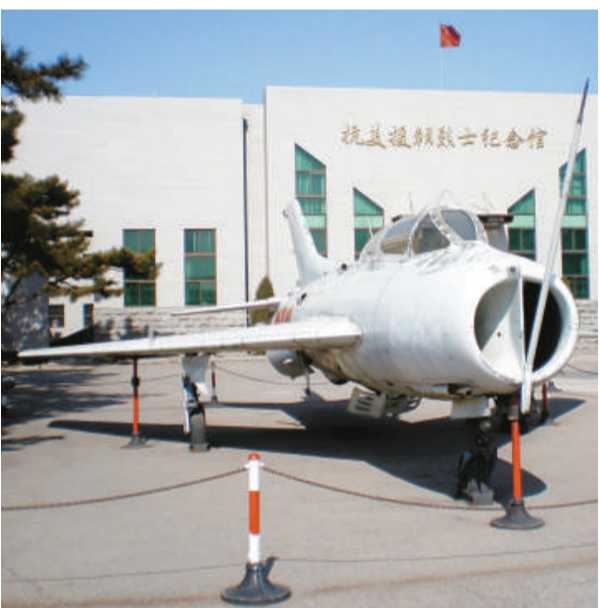
▲殲6戰機12日正式退出空軍編制序列 網上圖片

據新浪網介紹，國內一名空軍專家表示，殲6退役後主要有四個歸宿：狀態較好的將被封存，未來戰爭中可以重新擔負作戰任務；狀態較差的將被拆解，回收金屬；進博物館或在其他擔負愛國主義任務的地方繼續發揮餘熱；退役殲6在技術上可以改裝成無人攻擊機，在戰時能對敵方防空造成很大壓力。同時，還可以改裝成靶機，有效提高現役飛行員的實戰能力。