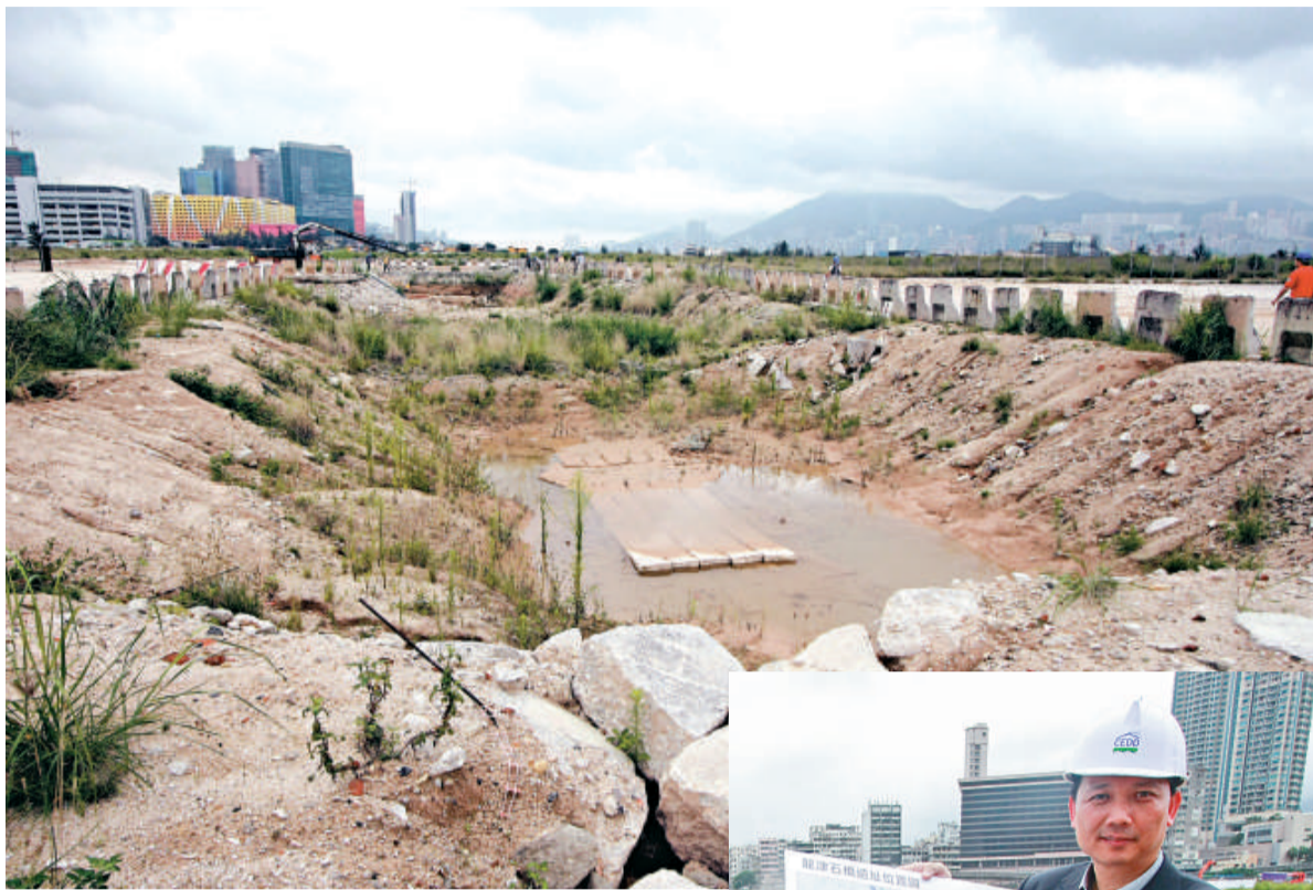
▲圖中為龍津橋較重要的其中一段的石橋橋面

署方將會根據三個保育原則保留龍津石橋，包括跟隨古物古蹟辦事處的建議，將石橋原址保留。由於石橋是當日官員及市民來往的水陸交通要道，因此保育將會