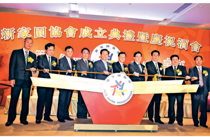
▲新家園協會成立儀式暨慶祝酒會

【本報訊】新來港人士往往面臨不適應問題，社會卻缺乏相關支援。為新來港人士提供跨境一站式服務的「新家園協會」昨日成立，以協助他們盡快適應及融入新生活環境，並推動他們積極投入和參與香港建設。