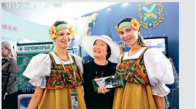
▲參觀者與俄羅斯姑娘合影

【本報記者于海江哈爾濱十五日電】今日，第二十一屆中國哈爾濱國際經濟貿易洽談會展覽館在哈爾濱召開。本屆哈洽會突出俄羅斯特色、科技創新特色，國際化程度越來越高，專業展區規模越來越大。