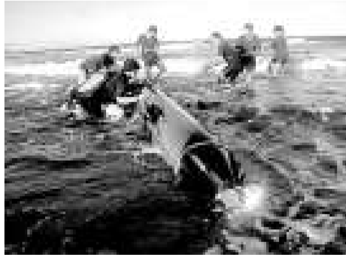
▲台軍海龍潛艦7年前在「漢光演習」中發生魚雷失蹤事件。圖為2003年台軍救難大隊士兵用手推、用繩索拉，勉強將試射失蹤的魚雷推至淺灘再固定