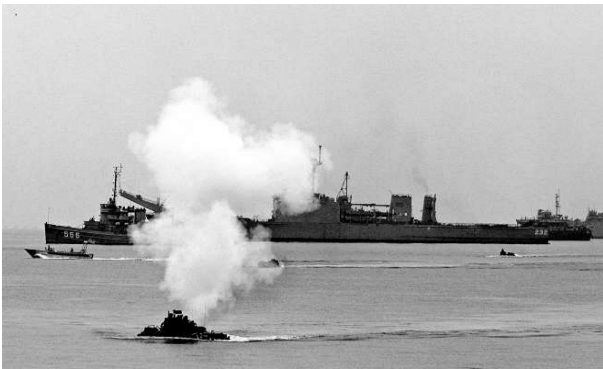
▲台軍每年定期舉行演習，卻不時傳出烏龍事件

海軍這次「走失」的魚雷，是劍龍級潛艦上配備的SUT（Surface and Underwater Target）重型魚雷的訓練用操雷，這型德國設計的雙用途導重魚雷，可以對付潛艦和水面艦。