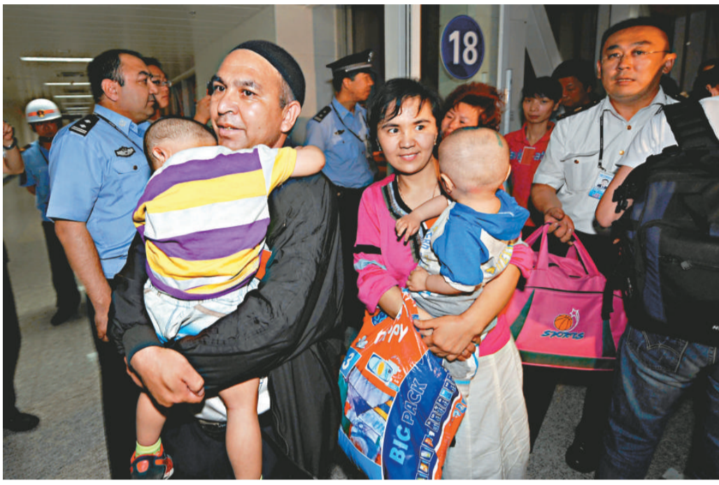
▲六月十五日，乘坐南航包機抵達烏魯木齊的撤僑走出機場廊橋

據悉，分布在吉國南部奧什、巴特肯和賈拉拉巴德等地有逾千名中國公民，其中600餘人要求盡快回國。中國政府高度重視在吉中國公民的安全，由外交部牽頭組成的兩個工作組已於14日分別趕赴吉爾吉斯斯坦和烏魯木齊協助開展撤僑工作。