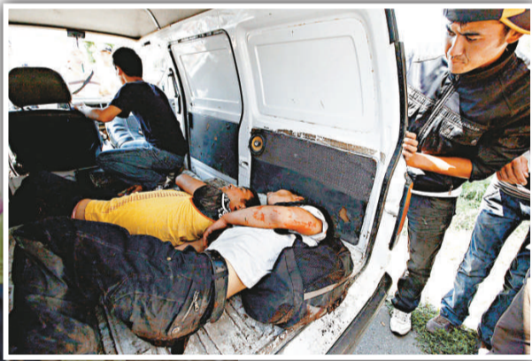
▲奧什街頭裝載屍首的汽車

聯合國安理會的代表們呼籲吉爾吉斯恢復法治。俄羅斯則警告，吉爾吉爾那令人「無法容忍」的局勢有可能失控。