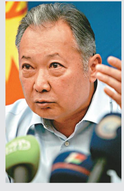
▲吉爾吉斯前總統巴基耶夫目前流亡白俄羅斯

流亡白俄羅斯的巴基耶夫，要求以俄羅斯為首的「集體安全條約組織」，派兵到吉爾吉斯協助平息種族騷亂。他指，吉爾吉斯臨時政府未能控制局勢，派出維持和平部隊，可以令局勢恢復正常。美國白宮發言人表示，總統奧巴馬有定期聽取吉爾吉斯局勢的簡報，華府官員亦與中亞國家，包括俄羅斯的官員保持密切接觸，了解局勢最新進展。