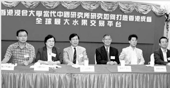
▲浸大公布有關香港發展全球最大水果交易平台研究報告