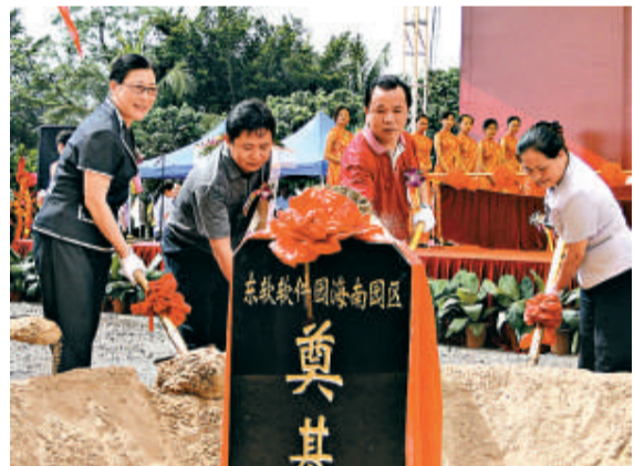
▲海南省副省長符桂花（右一）、澄邁縣書記楊思濤（右二）、澄邁縣縣長陳笑波（左二）等為東軟軟件園海南園區培土

國家發改委上月底公布本月起提高國產陸上天然氣出廠基準價格，每千立方米提高230元，提價幅度為24.9%。同時改進天然氣價格管理辦法，理順車用天然氣與成品油之間價關係。