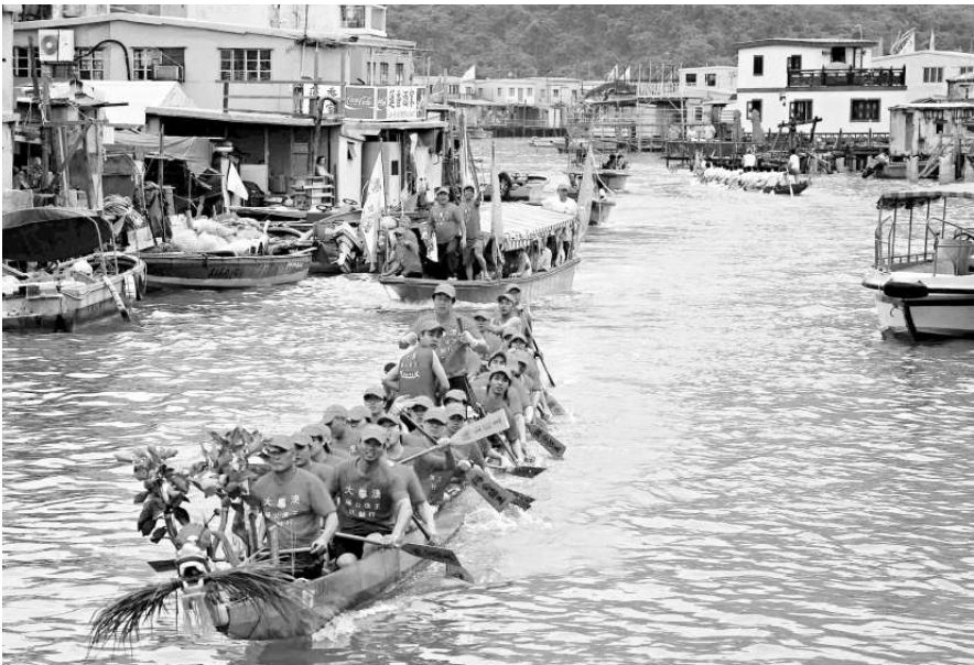
▲大澳的龍舟和神艇現今只在大涌巡遊