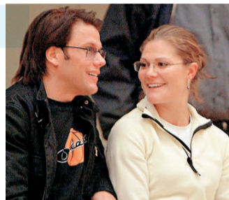
初相識的維多利亞公主和韋斯特林一起看球賽

出身卑微的韋斯特林從29歲到37歲，足足經歷了「8年抗戰」才修成今日正果。2002年，維多利亞公主和健身教練韋斯特林相識於首都斯德哥爾摩的健身房。當時，25歲的維多利亞是一個「問題公主」。她患上了嚴重的厭食症，精神空虛，為了打發時間，在妹妹瑪德琳公主的介紹下，她加入了韋斯特林經營的俱樂部。在訓練中，兩人漸生情愫。