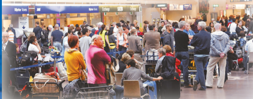
慕名而來的遊客比預期中少

事實上，除了挪威、丹麥這兩個鄰國外，其他歐洲國家王室都不怎麼重視這場婚禮。英國王室只會派最小的愛德華王子作代表，萬人迷威廉王子則寧願飛往南非看世界盃。(法新社)