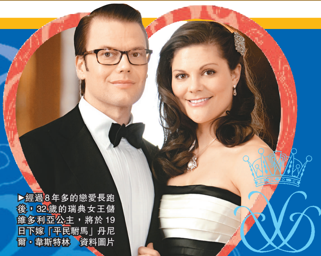
經過8年多的戀愛長跑後，32歲的瑞典女王儲維多利亞公主，將於19日下嫁「平民駑馬」丹尼爾·韋斯特林。