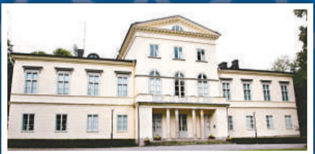
最後，公主和駑馬將入住斯德哥爾摩的哈加王宮。

接着，國王和王后將在斯德哥爾摩皇宮主持一場宴會。公主將擁有由十名小公主和小王子組成的伴娘伴郎團。預計她將在國王父親陪同下踏上教堂走道。不過，她這個決定最初曾引起轟動，因為瑞典素以別性平等見稱，新郎新娘通常都是肩並肩踏上教堂走道。