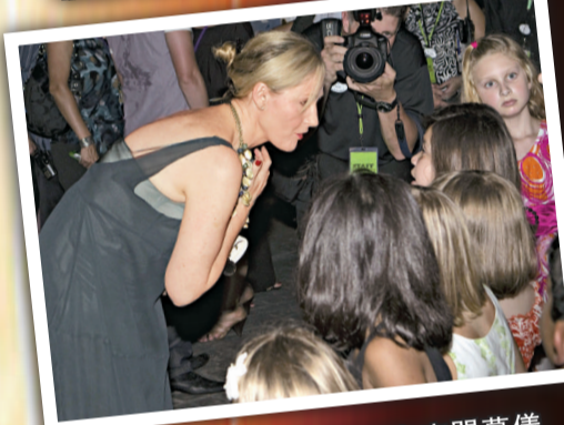
▲ 哈利波特作者羅琳也有出席開幕儀式