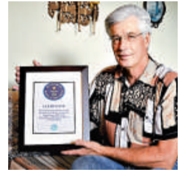
來自美國的羅傑·梅尼斯奪得了世界低音之王美譽

梅尼斯以前是福音歌手，他現在的工作是充當福音歌手和搖滾歌手巡演的巴士司機。他說，