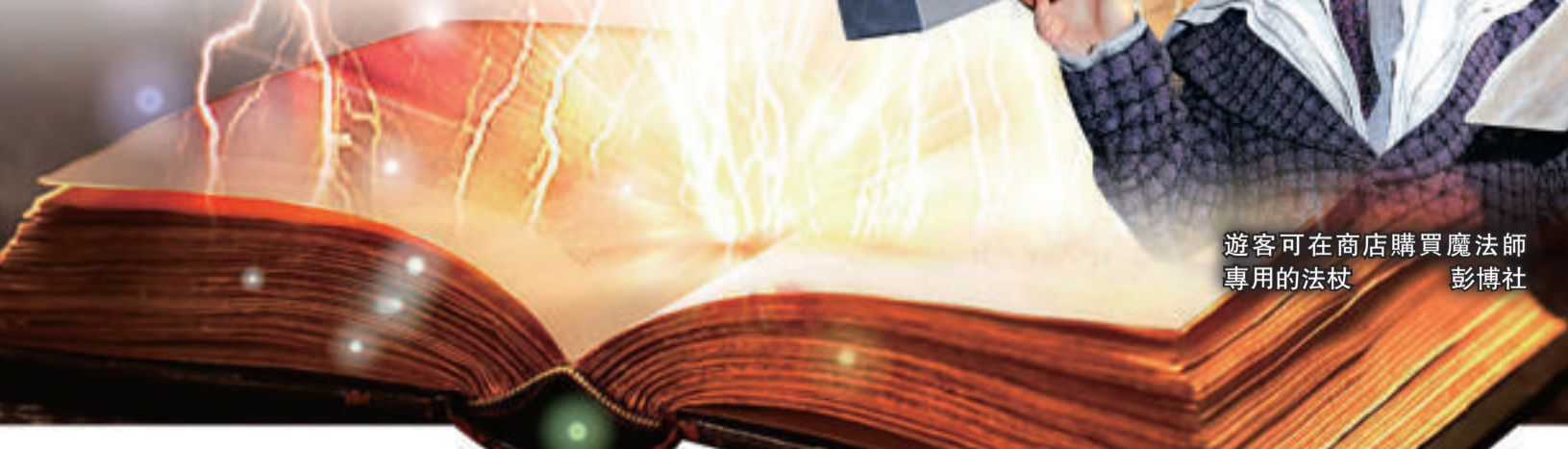
遊客可在商店購買魔法師专用的法杖