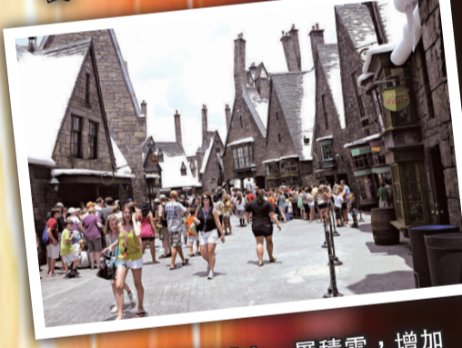
▲ 樂園的建築物鋪上一層積雪，增加魔法世界的真實感