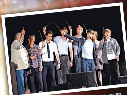
▲ 飾演哈利波特的丹尼爾·雷德克里夫是開幕儀式的嘉賓之一

參演《哈利波特》電影的演員們也形容，這個公園讓人不知不覺深入哈利波特的世界中。丹尼爾·雷德克里夫說：「身在這裡，幻覺從未消失過。」湯費頓就想起最初有關這個公園的種種傳言。他說：「我們身在這裡了。我們的夢想成真了，《哈利波特》傳奇將延續下去了。」