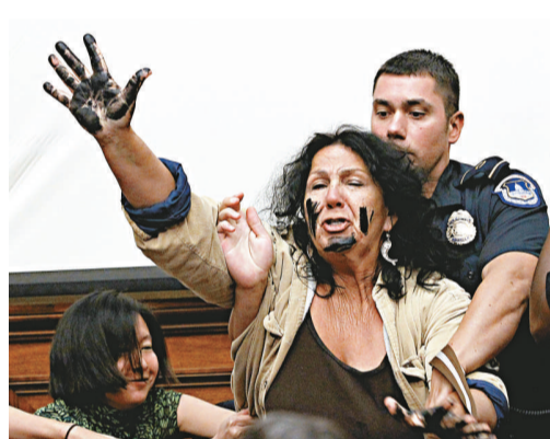
▲有示威者在會場內高聲抗議，該名自稱是漁民的女子被警衛帶走