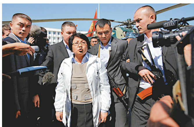
▲吉爾吉斯臨時總統奧通巴耶娃(中)身穿防彈衣到訪奧什

【本報記者黃曉敏紐約十七日電】吉爾吉斯臨時政府總統奧通巴耶娃十八日飛抵南部奧什市，視察發生騷亂的地區。她指騷亂實際死亡人數可能會比官方公布的一百九十一人，高出十倍。原因是很多人死於鄉郊地區，而他們的習慣是即時將死者埋葬，可能令死亡數字被低估。此外，聯合國難民署十七日稱，吉爾吉斯斯坦境內的流離失所者人數目前估計達到三十萬，跨越邊境進入烏茲別克斯坦的難民人數有約十萬。