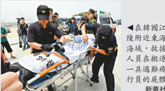
▲在韓國江陵附近東海海域，救援人員在搬運一具遇難飛行員的屍體

據報導，F-5F戰鬥機於一九八三年在韓國組裝生產，可搭載AIM9響尾蛇空對空導彈。失事飛機的飛行時間累計超過九千小時。