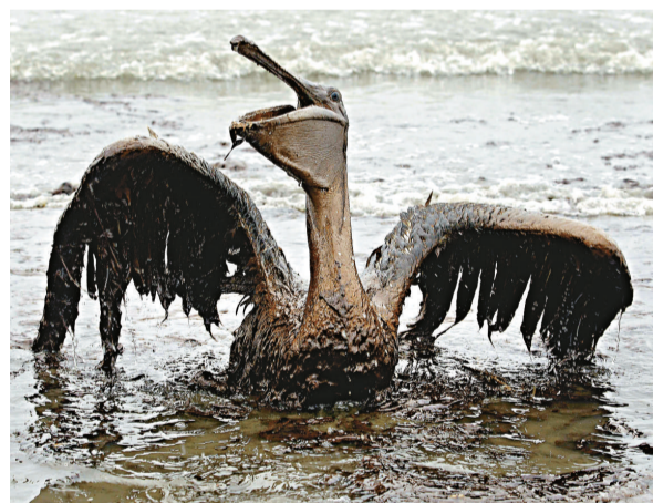
▲路易斯安那海岸的鵝鴨渾身沾滿油污

這二十二個提供援助的國家包括：比利時、英國、加拿大、中國、法國、德國、愛爾蘭、日本、墨西哥、荷蘭、卡塔爾、挪威、韓國、西班牙、瑞典、阿聯酋和越南等。很多國家是通過國際海事組織提供援助的，該組織亦有把漏油情況通知其一百六十九個成員國。