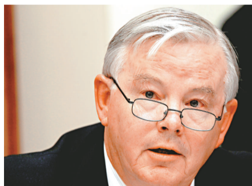
▲得州眾議員巴頓指BP遭白宮政治敲詐