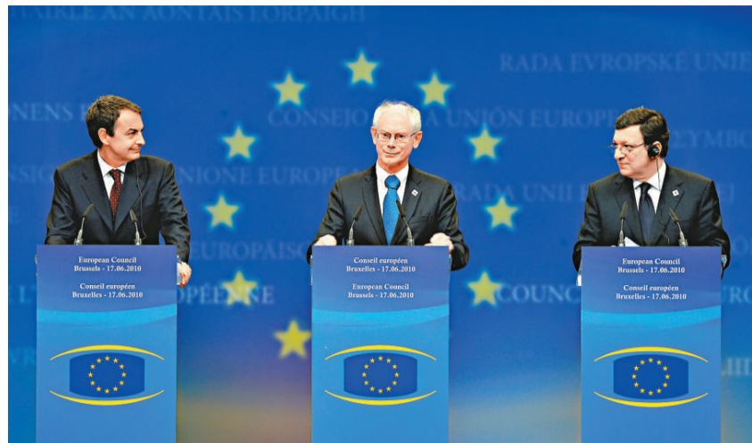
▲歐盟輪值主席國西班牙首相薩帕特羅、歐洲理事會常任主席范龍佩和歐盟委員會主席巴羅佐(從左至右)十七日在布魯塞爾出席記者會

【本報訊】綜合外電報導，歐盟成員國領導人在十七日的峰會上，通過未來十年經濟發展戰略等一系列改革方案，以期引領歐盟經濟走出債務危機，增強競爭力。 歐洲理事會常任主席范龍佩在會後表示，歐盟領導人最終敲定歐洲2020年戰略的五大核心目標，為歐盟推進結構性改革，重新邁上可持續增長的道路和創造就業明確目標。 根據這份指導歐盟經濟未來十年發展的綱領性文件，歐盟經濟將實現以知識和創新為基礎的「靈巧增長」，以提高資源效率、提倡「綠色」、強化競爭力為內容的「可持續增長」，以擴大就業、促進社會融合的「包容性增長」。為此，歐盟領導人在創造就業、增加科研投入、減少溫室氣體排放、提高教育普及率及消除貧困等五個方面達成了量化指標，歐盟成員國將落實到各自的國家行動計劃中去。 作為債務危機爆發後的重要改革舉措，歐盟領導人同意今後強化財政紀律和加強對成員國的宏觀經濟監督，以避免債務危機重演。為此，在尊重各國預算主權的前提下，自2011年開始，成員國的預算方案應接受歐盟委員會的評議，對違反歐盟財政紀律的成員國將實施懲罰。 在加強金融監管方面，歐盟領導人強調，盡快推進相關立法，在2011年底前完成既定的改革舉措，並對沖基金和信用評級機構加強監管。與此同時，歐盟委員會將拿出建議，對金融衍生品市場加強監管，尤其是賣空行為和信用違約掉期合約。 為期一天的歐盟峰會也為二十國集團多倫多峰會協調了歐盟內部立場。歐盟領導人表示，支持徵收銀行稅，並主張在多倫多峰會上繼續推動達成全球性協議。