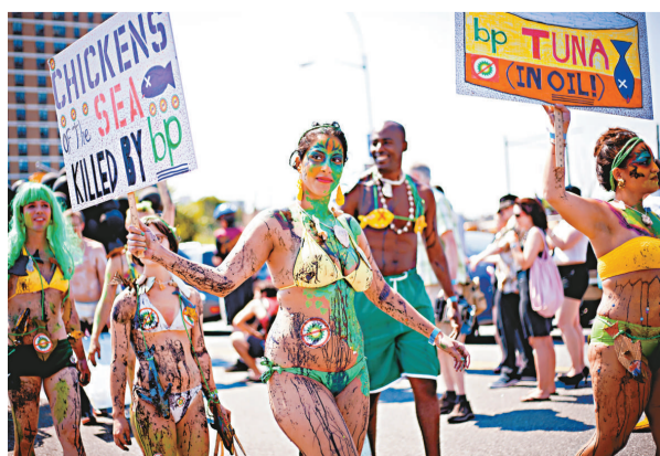
▲6月19日，在美國紐約康尼島的海濱，遊行抗議英國石油公司造成的墨西哥灣石油污染

另外，位於美國路易斯安那州的新奧爾良市最近推出全新一輯的旅遊廣告，希望吸引遊客重來，但當局接到投訴，指其中一款印刷廣告拿英國人開玩笑，有「反英」之嫌。當局決定抽起這個廣告。