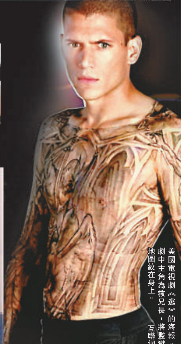
美國電視劇《逃》的主角為救兄長，將監獄地圖紋在身上。