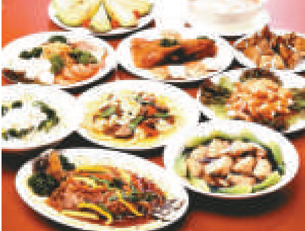
▲澳洲人外出用餐最愛中國菜 互聯網

相關報道將刊載在《特易購》的7、8月號上。該刊編輯萊斯女士驚訝地表示：「我自己也是個媽媽，但連我都很訝異，如果要酬謝母親，得花這麼多錢。」