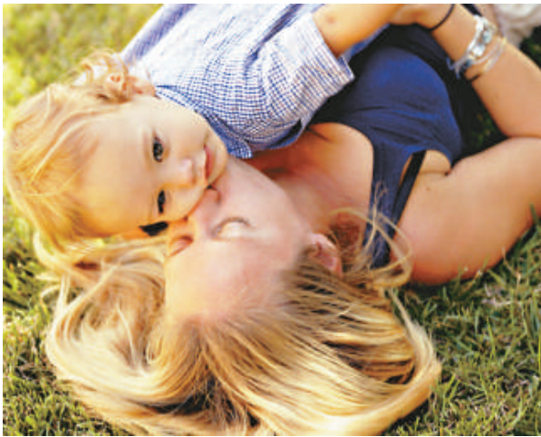
▲母親把孩子撫養到18歲，育兒薪酬總額可高達1643.7萬元 互聯網