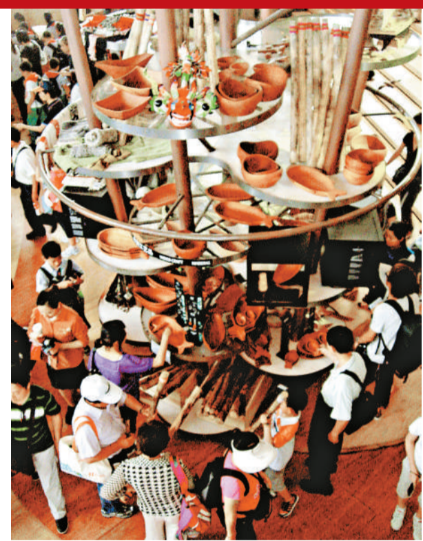
▲除各國家館銷售的名牌產品外，一些手工藝品也因合理的價格受到遊客的青睞

遊世博除觀展外，世界各國的精品顯然給購物達人們開啓了一次「血拚」之旅，不出國門即能在園區內買到各品牌的限量版，或世博定製品，無疑令所有鍾情國際大牌的遊客蠢蠢欲動。