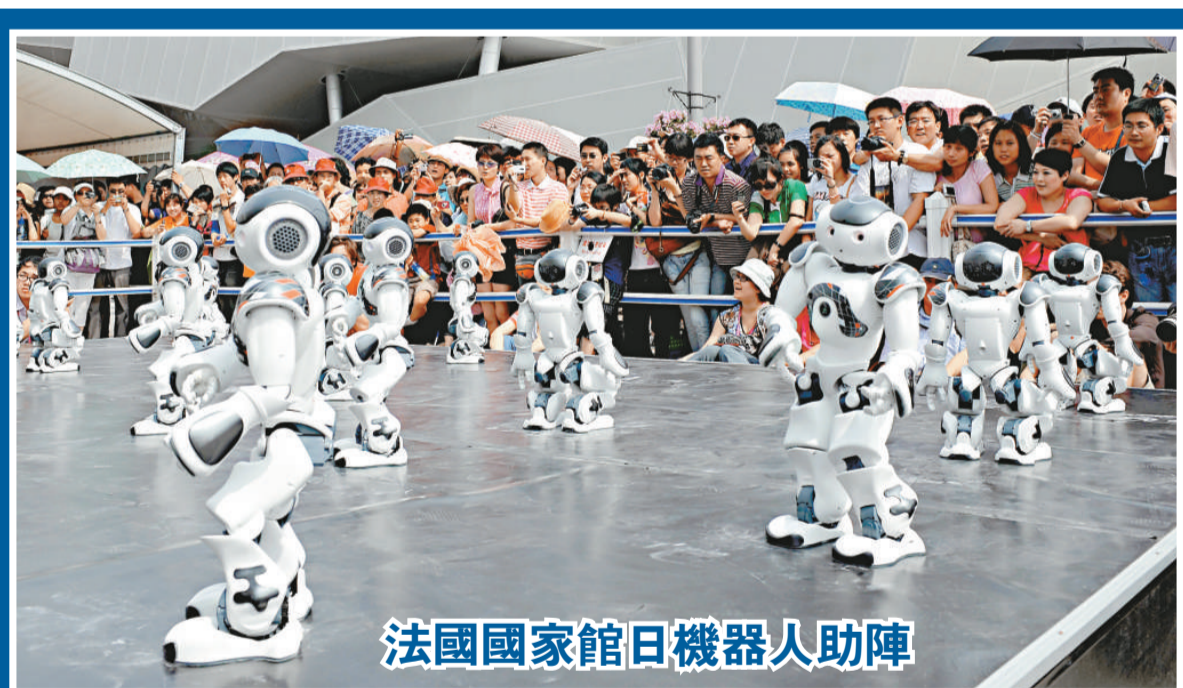
法國國家館日機器人助陣