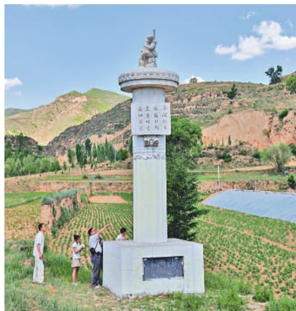
▲國家文化部為婁煩縣打造「花果山」立碑題詞