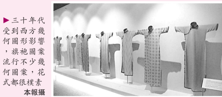
▶三十年代受到西方幾何圖形影響，旗袍圖案流行不少幾何圖案，款式都很樸素