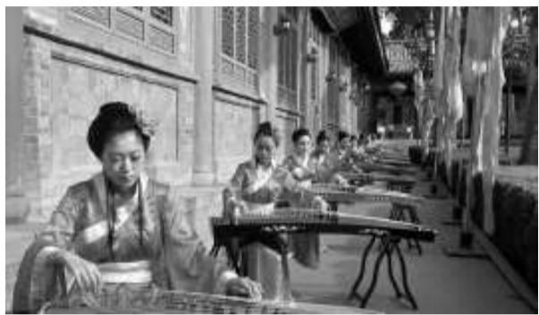
▲樂舞告祭其中一個場面——古箏彈奏

【本報記者葉小娜天水二十二日電】甘肅公祭中華人文始祖伏羲大典，今早在悠遠的古樂聲中開始祭祀，祭文中「三皇之首，肇啓炎黃；繼天立極，道傳百王。伏羲文化，經天緯地；日月同輝，萬代承繼……」深刻表達了人們對伏羲文化的傳承與理解。