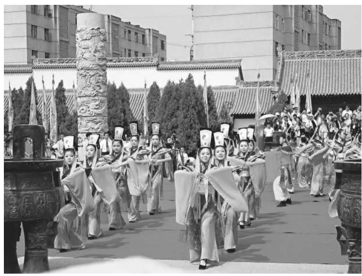
▲樂舞告祭的第一樂章「樂舞頌祖」