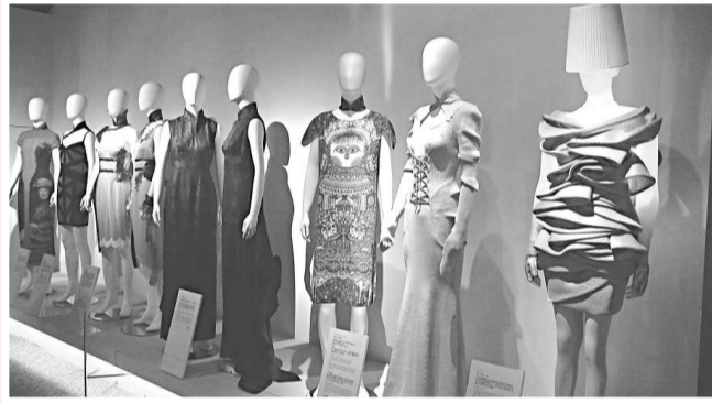
▶理工大學幾位教員設計的現代式旗袍