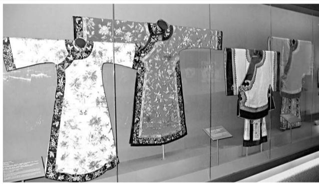
▶清代滿族八旗婦女所穿的長袍（左邊兩件）及漢族女性所穿的上衣下裳都是闊袍大袖