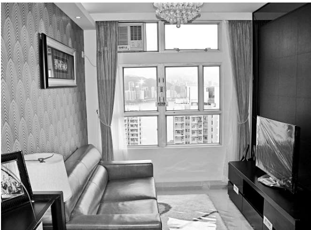
▲油翠苑淡美閣高層單位可遠眺維港海景，成為今期居屋發售的焦點

【本報訊】房委會新一期三千二百一十九個居屋貨尾單位，今日開始接受申請，預計將掀起市民搶購潮，房委會已印備三十二萬份申請表格派發。房委會今期共開放十個清水房示範單位，其中油翠苑佔九個，是近期最多的一次。而油翠苑今期單位景觀較上期優勝，高層單位客廳更坐擁維港海景。