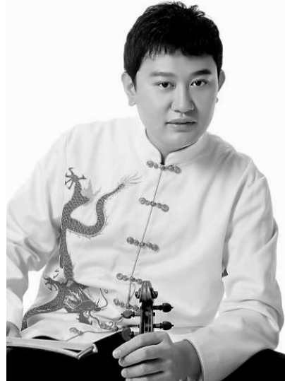
陳曦十七歲時奪得柴可夫斯基國際音樂比賽小提琴賽銀獎

【本報訊】記者王一梅深圳報導：著名旅美青年小提琴家陳曦與韓國指揮家咸信益，將於七月二日晚上八時亮相深圳，參與深圳交響樂團二〇一〇春夏音樂季演出。