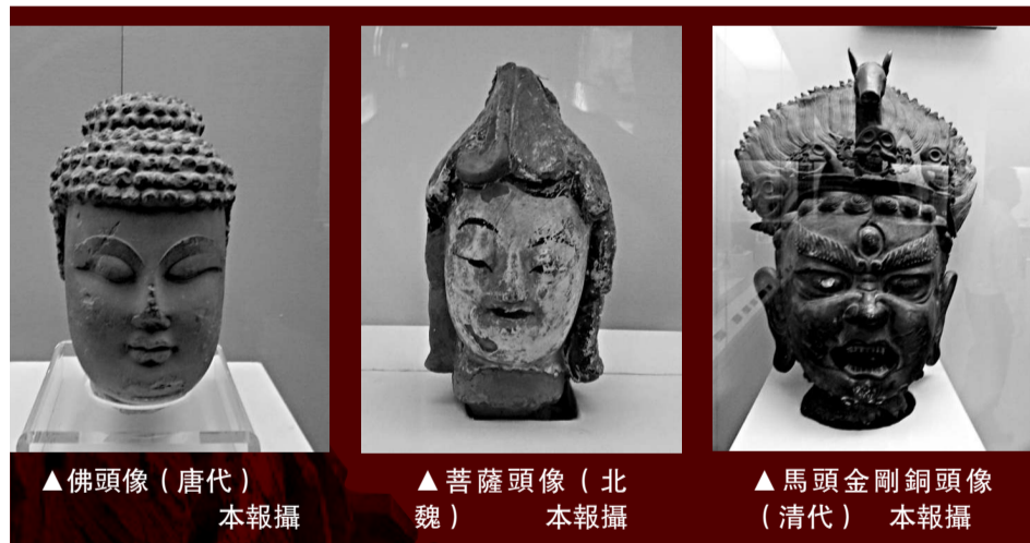
▲佛頭像（唐代）本報攝 ▲菩薩頭像（北魏）本報攝 ▲馬頭金剛銅頭像（清代）本報攝