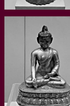
▲鎏金藥師佛造像（明代）