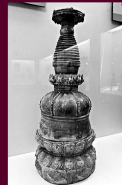
▲蝴蝶裝妙法蓮華經（西夏）本報攝 ▲琉璃塔（元代）本報攝