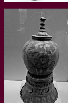
▲彩繪寶相花紋灰陶瓶（唐代）本報攝