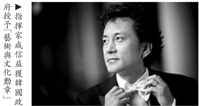
指揮家咸信益獲韓國政府授予「藝術與文化勳章」

富有創新精神的指揮家咸信益，曾獲得波蘭第四屆菲特爾伯格國際指揮比賽獎，由伊斯曼音樂學院和詩伯德社會基金授予的沃爾特·哈根指揮獎，並於一九九七年獲邀參加美國交響樂團指揮聯盟巡迴。一九九五年，咸信益獲韓國政府「藝術與文化勳章」，以表彰其在紀念韓國獨立五十年演出中的傑出貢獻。