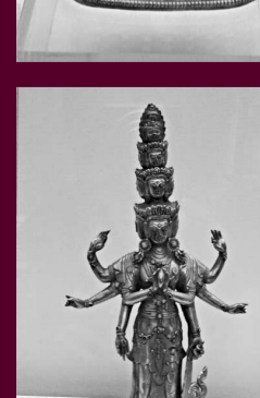
▲鎏金十一面觀音像（明代）