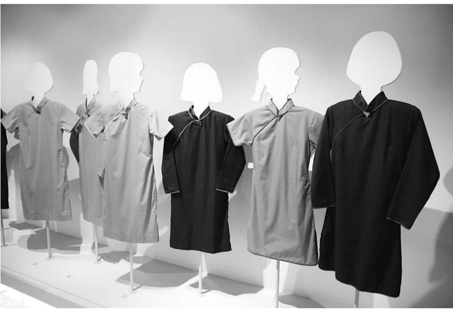
香港現今仍有不少中學以長衫為女生校服