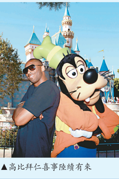
▲高比拜仁喜事陸續有來

【本報訊】據新華社洛杉磯二十四日消息：第16次奪得NBA總冠軍的洛杉磯湖人隊有望贏得另外三場勝利；這支勁旅以及當家球星高比拜仁和教練菲積遜獲得享有體育界奧斯卡美譽的2010年卓越體育成績年度大獎（ESPY）提名，將與其他體育強隊、運動員和教練一起展開最佳球隊、最佳男運動員和最佳教練三個項目的競爭。