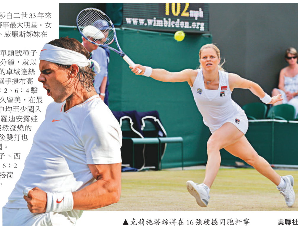
▲克莉施塔絲將在16強硬撼同胞軒寧