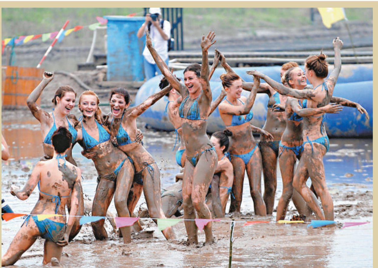
「2010舟山群島·新絲路國際海洋小姐大賽」（7月5日舉行總決賽）的50名中外美女「玩泥巴」各國佳麗，28日齊聚浙江舟山岱山縣秀山島參加浪漫海泥之旅，參加滑泥大賽、泥中拔河等活動，體驗海泥遊戲帶來的快樂，也展示各自的美麗風采。圖為佳麗們在泥水中慶祝比賽勝利。 新華社

武博會是一項全新的綜合性體育比賽，由世界體育總會創辦，每四年舉辦一次。據最新統計，目前已有105個國家和地區的1904人確認參加首屆賽事，其中包括運動員997名、裁判員221名、官員203名、其他人員483人。