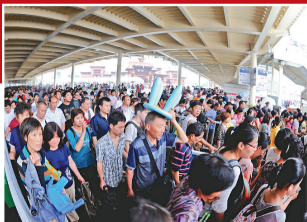
▲上海世博會官網統計，截至6月28日下午2時30分，世博園累計參觀人數已超過2021萬人次。圖為遊客當天在沙特館外排隊輪候入場