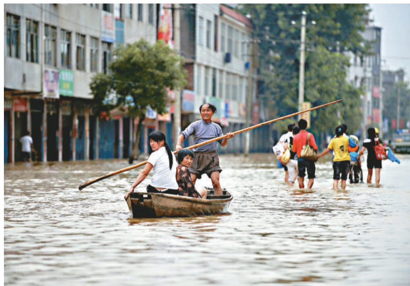
▲一家三口27日在被洪水淹沒的江西省撫州市街道上划艇前行。這些災情經過網絡傳播，可迅速被當地防汛指揮部門緊急協調，進行搶險

罕見的洪水沖毀通訊設施，導致通信中斷、增加救援難度——南方發生洪災後，很多地方遇到的共同難題