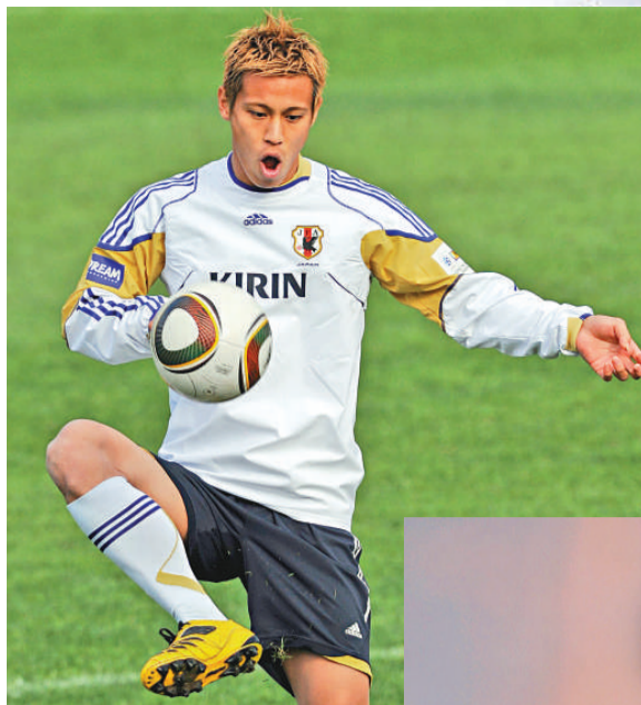
▲本田圭佑主罰的定位球是日本隊最強大的武器