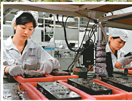
▲▼富士康深圳工廠的員工亦將銳減至10萬人，圖為富士康前線員工正在工作 資料圖片

有富士康的管理層匿名受訪稱，公司已針對工程師及管理幹部開小範圍民意調查，旨在挽留具備經驗的中高端人才。